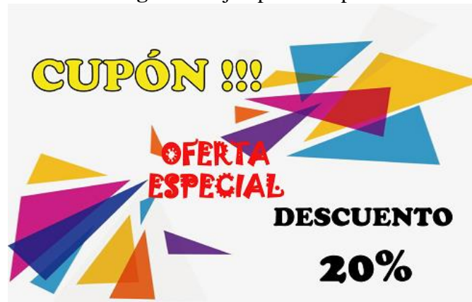
Figura 4. Ejemplo de cupón