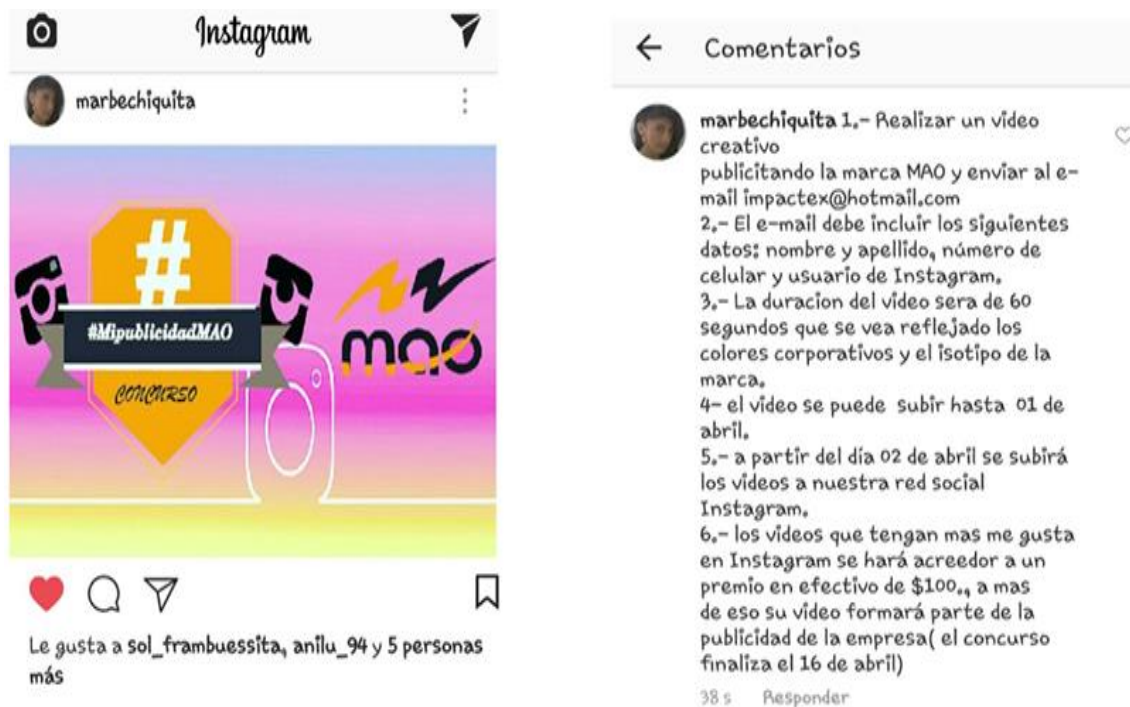
Figura 5. Concurso en Instagram