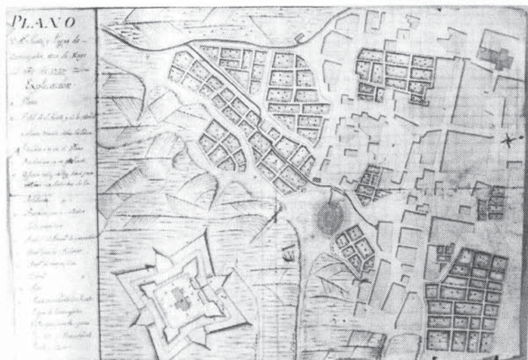
Plano de Carbajales y un Fuerte Militar (s. XVIII)