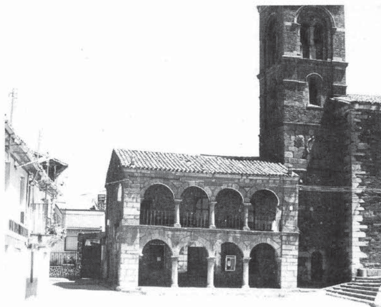
Casas Consistoriales de Carbajales