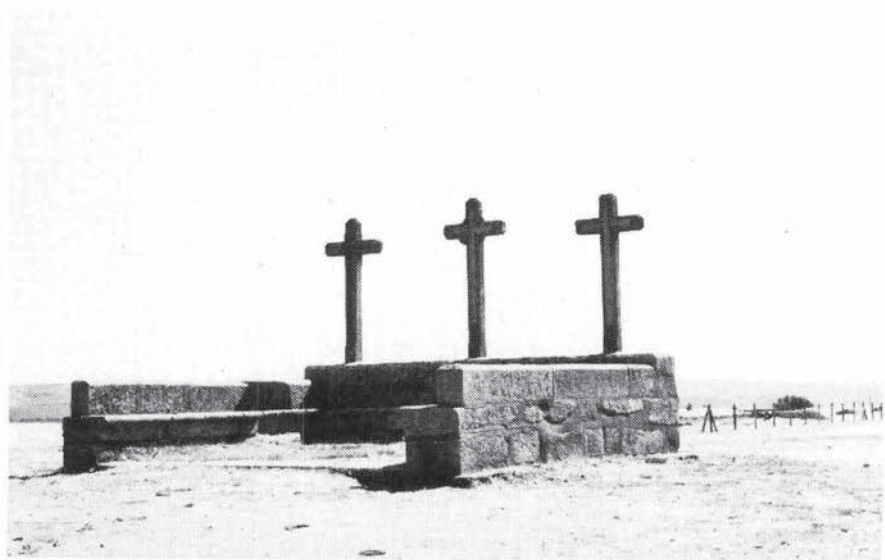
Crucero: lugar de deliberaciones de la gente de la Tierra de Alba