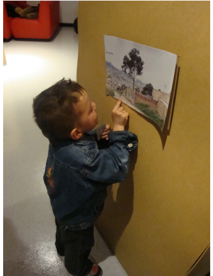
Imagen 2. Exposición de fotografías realizada en la Pontificia Universidad Javeriana