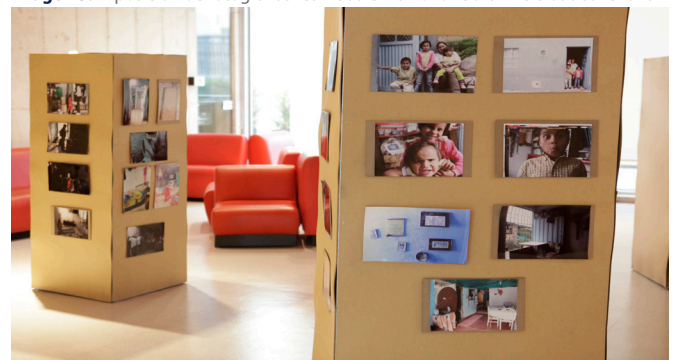
Imagen 3. Exposición de fotografías realizada en la Pontificia Universidad Javeriana