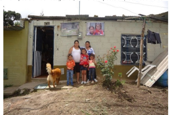
Imagen 4. Exposición de Fotografías, barrio Compostela II, localidad de Usme