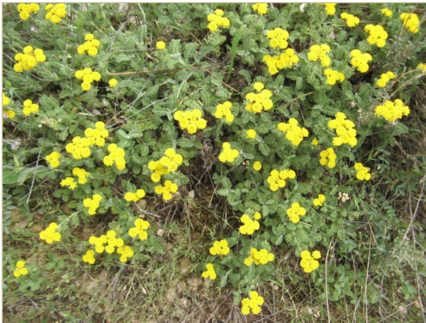
Fig. 2: Tanacetum vahlii en flor.