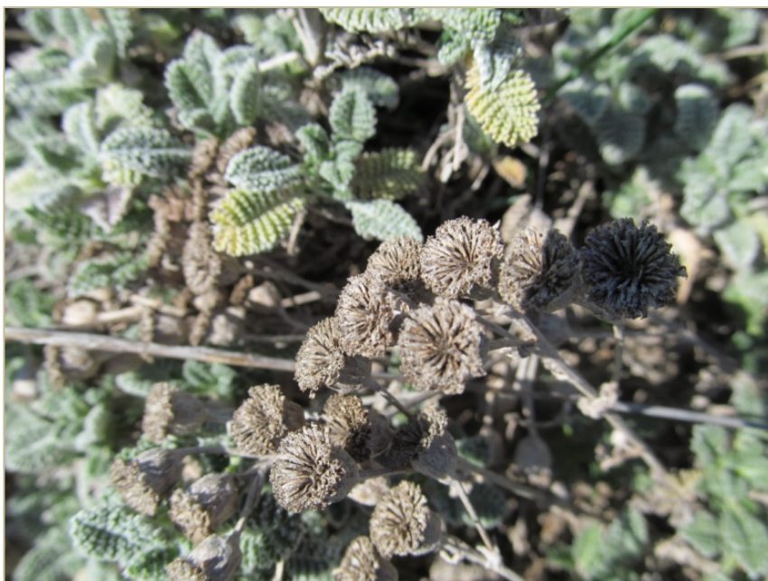
Fig. 3: Detalle de hojas y capítulos fructificados de Tanacetum vahlii .