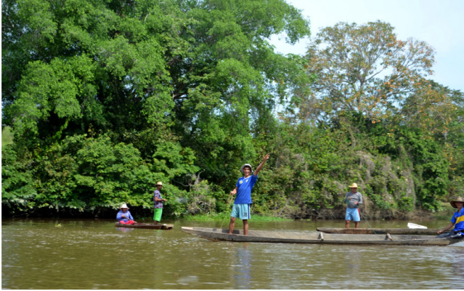
Foto 2. Por las aguas del Cimitarra