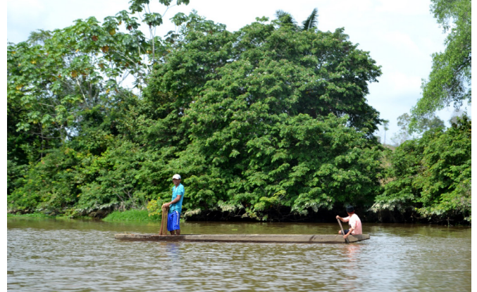
Foto 3. Tras las huellas de los guardianes del río

La territorialidad, promovida por los campesinos de tierra y agua es una forma de defensa de los recursos naturales, ya que estos son de uso colectivo. Esto, en contraposición a las actividades que hoy tienen un papel protagónico en la rivera de los ríos, principalmente la explotación de hidrocarburos (petróleo), los monocultivos de