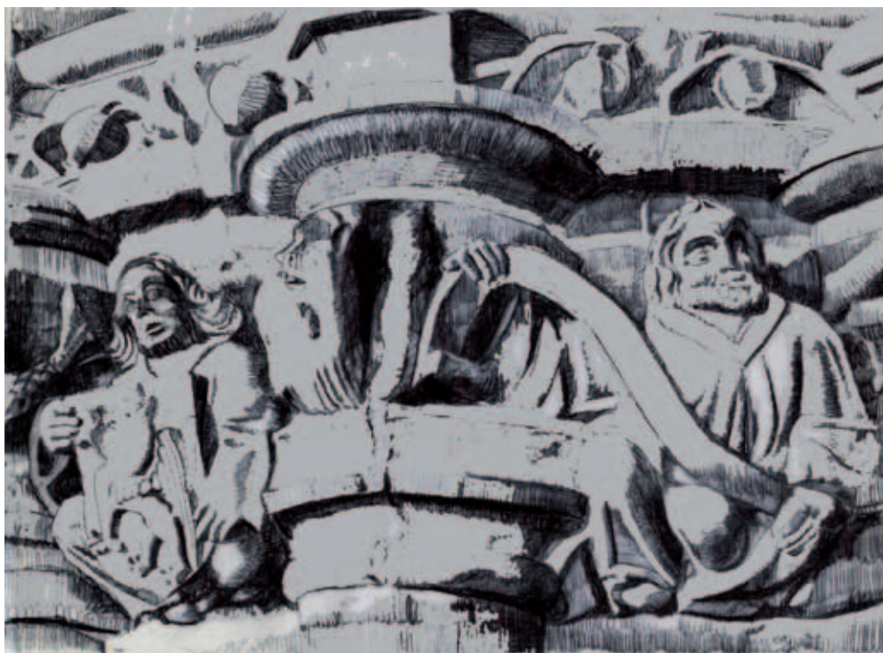
A la izquierda, figura masculina con el escudo de los Espés. (Dibujo realizado por M. a Celia Fontana Calvo a partir de la foto publicada por Antonio Durán Gudiol en su Historia de la catedral de Huesca, Huesca, IEA, 1991, p. 138)

general de la construcción alcanzaba solo la de las naves laterales y las capillas exteriores. En los brazos del crucero, a ese nivel, todavía se aprecia la vertiente de un tejado a dos aguas, huella que ha de corresponder a una cubierta provisional compuesta totalmente por rollizos. El crucero y la nave central no tenían todavía su altura definitiva y por tanto no se habían abovedado. Solo el presbiterio, por su prelación, se habría cubierto inicialmente con bóveda, cuya clave, con las armas de su promotor —el iniciador del edificio catedralicio, el obispo Jaime Sarroca—, fue recolocada en un nuevo cierre dispuesto a mayor altura, como ha señalado Carlos Garcés. 2 No se dispone de documentación al respecto, pero seguramente la segunda bóveda fue hecha poco después