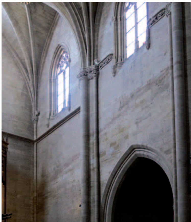
Muro occidental del brazo sur del crucero. La diagonal que baja de derecha a izquierda es la huella dejada por el tejado provisional.