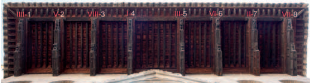
Canes numerados de acuerdo con su ordenación original, señalada en números romanos, y con la actual, con arábigos.