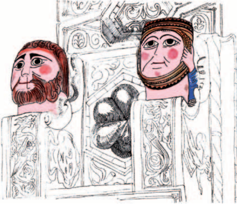
Sordera judía representada en uno de los tirantes de la catedral de Santa María de Teruel mediante un eclesiástico y una mujer judía que se tapa los oídos. (Dibujo: M. a Celia Fontana Calvo)

hacia 1288 a modo de summa del saber de su tiempo. Las miniaturas del manuscrito conservado en la Biblioteca Nacional de España (Res/203), el más antiguo de los ilustrados, aluden a la incomprensión judía de las profecías sobre Cristo mediante un diablo que impide al judío no ver, sino oír, al aplicarle una sonora trompeta en la oreja. 43 También se dibujó un diablo que estorba la audición en otro de los manuscritos, el conservado en la British Library, en Londres (ms. Yates Thompson 31, f. 132r). 44 En este caso el demonio, ante el anuncio del profeta, tapa con sus manos los oídos del lector. La obra del fraile francés atacaba el problema de raíz, porque los judíos podían negar los Evangelios, pero no los libros de los profetas o Nevi'im , que, a pesar de que no estaban incluidos en la Torá, consideraban de origen divino. El profeta tallado en el