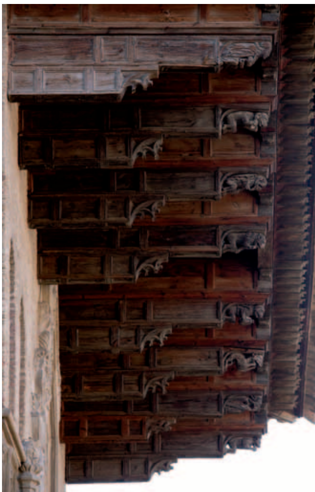
Tejaroz sobre la portada de la catedral de Huesca (ca. 1480) tras la restauración que cambió el orden de los canes.