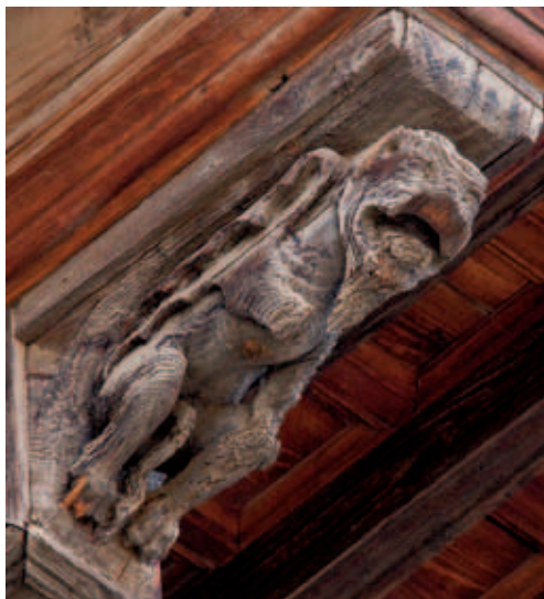
León y dragón judíos. Ambos se muerden la mano derecha.