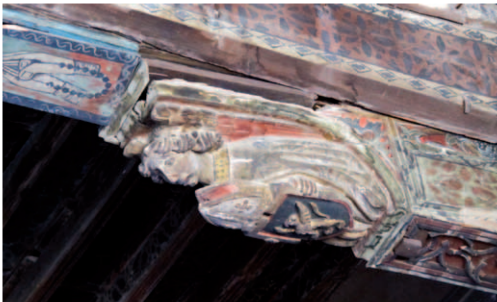
Escudo del obispo Espés, sostenido por un ángel, y manos en oración. Techumbre del salón del Tanto Monta durante su restauración (2012).

las esferas de poder de la Iglesia y el Estado en el momento eran amplias y los límites entre ambas muy difusos. El obispo pudo hacerse eco de las enormes expectativas que estaban puestas en Fernando 26 y señalarle lo necesario para conseguir el éxito. En una tablilla descubierta durante la restauración (alzado del can VIII) 27 se lee: “Lo que raçõn no alcança alcança fe y sperança”. Este lema rodea la imagen de un astrolabio, un instrumento de medida que en la composición representa la razón. Con dicha frase Espés apelaría a su —en cierta forma— equívoca etimología, porque el aparato no puede alcanzar las estrellas, como cabría deducir por su nombre, compuesto de * astr- ‘estrella’ y el verbo lambano ‘coger’, cuya raíz es * lab- . 28 El astrolabio mide la altura de los astros en grados con respecto al horizonte, pero, obviamente, no logra llegar a ellos. A juzgar por el lema, solo la fe (representada por las manos orantes entre las llamas del