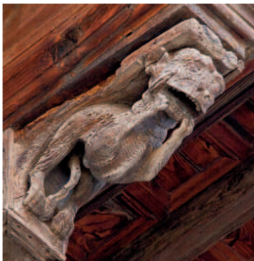
Rabino y perro judíos. El primero se muerde la mano derecha y el segundo las dos.