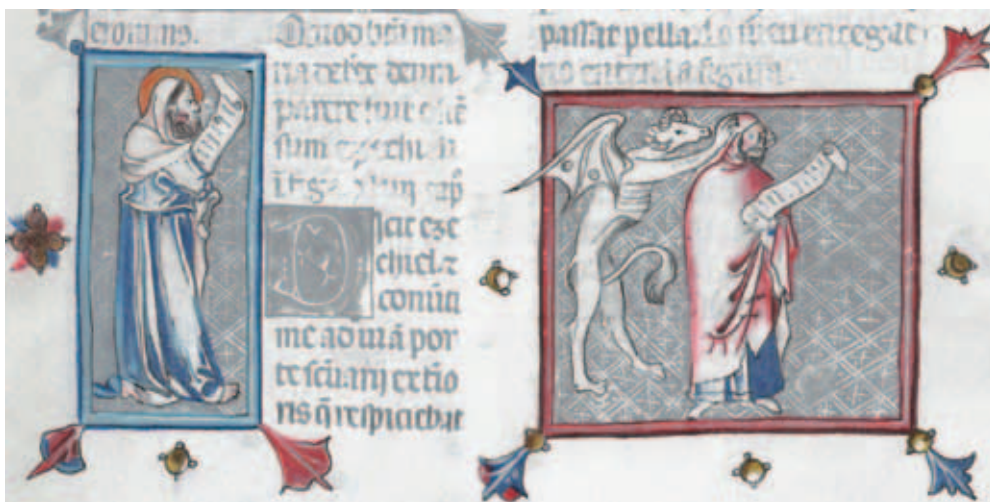
A la derecha, un demonio tapa los oídos a un judío para impedir su correcta interpretación de las profecías sobre Cristo. (Dibujo realizado por M. a Celia Fontana Calvo a partir del Breviari d'amor, British Library, ms. Yates Thompson 31, f. 132r)

Este contexto permite identificar en el tejaroz de Huesca a la pareja mencionada antes, el hombre con ropa talar (III-1) y el perro de largas orejas (v-2), como un profeta y un judío animalizado, este incapaz de escuchar —o más bien de comprender, dada su condición— la doctrina del primero. El profeta puede ser Isaías, que anunció a Cristo (Is 7,14; 9, 1-2 y 6-7; 11, 1-10; 40, 3; 41, 8-9; 42, 1; 49,1; 53, 2; 61, 10), o más probablemente David, porque a él se le atribuye en el credo profético (escrito en correlación con el apostólico) el anuncio del nacimiento del Mesías, que es precisamente, como se ha dicho, el episodio representado debajo del tejaroz. Su letrero habría contenido la frase “Dominus dixit ad me filius meus es tu” (a partir de Sal 2,7) u otra similar. 45