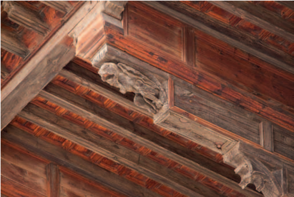
Tejaroz con parte del maderaje sustituido en la restauración de hacia 1965.

los añadidos que alteraban su composición, impedían la visión de las formas más destacadas y afeaban su apreciación de conjunto. Los arquitectos idearon entonces retirar, entre otras cosas, el citado mirador, salvo en su parte central —la del tejeroz—, porque esto, “independientemente de cambiar totalmente la fisonomía de la fachada, llevaría consigo un grave problema [...] para completar la portada”. 36 En el nuevo proyecto, redactado en 1960, los arquitectos destacaron el tejeroz por ser “un alero mudéjar de gran vuelo, que aun cuando interrumpe el gablete de la portada, es uno de los elementos de la composición que contribuye con más fuerza a dar al conjunto el carácter”. 37 Sin duda a partir del citado estudio de Del Arco, fecharon el tejeroz en 1574.