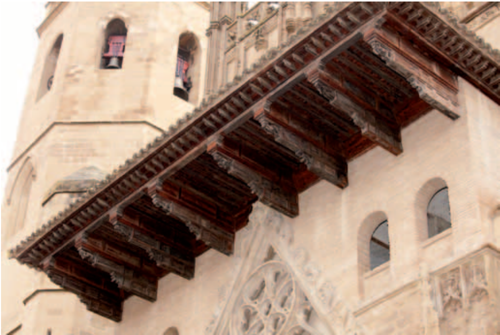
Tejaroz integrado en la fachada de la catedral. Se elevó hacia 1965 para librar el gablete gótico.

De hecho, las esculturas de ambos trabajos no solo tienen alguna afinidad. En sí, las figuras presentan un gran parecido, y en ambos casos constituyen el recurso expresivo más importante, tanto desde el punto de vista formal como desde el iconográfico. Por lo demás, el salón y el tejeroz se adecúan a la perfección al plan argumental del obispo Espés, que parece tener como telón de fondo los trascendentales sucesos políticos nacionales ocurridos en el último tercio del siglo xv.