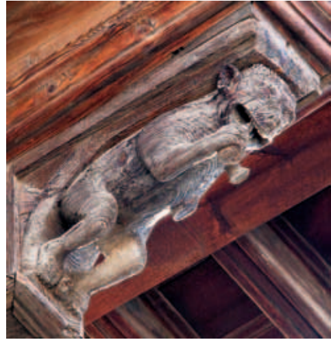
Humanoides judíos. El primero sostiene una cantimplora y el segundo una redoma.

En la actualidad la primera figura por el lado izquierdo de la fachada es un personaje de barba corta y vestidura talar, descalzo, que se cubre con un exótico tocado y lleva un pergamino en las manos. Inicialmente, como indica su número, IIII, se ubicaba en el centro del rafe y sobre el tímpano de la portada, en el lado del evangelio, de más dignidad que el contrario. Su caracterización y su posición originales le proporcionan la relevancia necesaria para considerarlo un personaje principal y básico en el discurso. Incluso permiten relacionarlo con el tema de la epifanía que se desarrolló debajo, en el tímpano. De gran interés también es un perro muy particular (v-2) que dobla sus larguísimas orejas hacia abajo, como si con ello pudiera tapar sus oídos. Antes el perro, colocado en el lado de la epístola —al lado derecho del gablete—, hacía pendant con el hombre del pergamino. Ahora queda a su lado y se le ha elevado de categoría involuntariamente al reubicarlo en el lado del evangelio. Su elocuente gesto remite a la sordera judía, enlazada con la proverbial ceguera, defectos ya señalados ampliamente en los evangelios de san Juan (Jn 9) y san Pablo (Hch 28, 16-26).