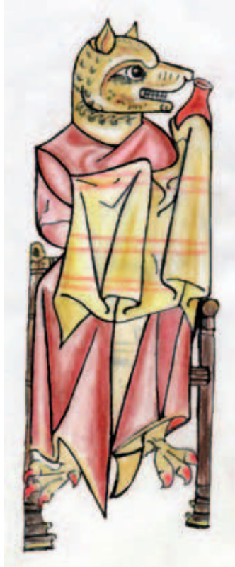
Perro judío con redoma en la techumbre de la catedral de Teruel. (Dibujo: M. a Celia Fontana Calvo)

acusación documentada tuvo lugar en 1321 en Aquitania, que sufría entonces una epidemia de lepra. Primero fueron señalados como responsables de la contaminación los leprosos, hasta que se les consideró solo agentes de los verdaderos responsables, los judíos. 52 Las inculpaciones se multiplicaron con motivo de la famosa peste negra de 1348, de forma que en muchas localidades la mortandad fue achacada a pociones mágicas preparadas por hechiceros judíos, lo que motivó asaltos a las juderías. 53