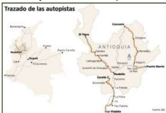
Mapa 2: Trazado de las autopistas