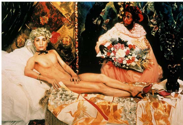
Figura 1. Yasumasa Morimura. "Portrait (Futago)". Fotografía. 1988.

Un ejemplo de artista contemporáneo que integra este tipo de operaciones es Yasumasa Morimura (1951), artista visual de origen japonés. Su obra se caracteriza, a grandes rasgos, por apropiarse de diversas obras famosas de la historia del arte occidental, de las que él se hace parte disfrazándose y reemplazando a los personajes principales, muchas veces femeninos, a través de una puesta en escena fotográfica. El autorretrato y travestismo 5 de su propio cuerpo son fundamentales a la hora de parodiar y alterar los códigos epocales de cada obra en cuestión. Juega así entre la realidad de la fotografía y la pintura o foto original 6 , incluyendo también otros elementos con el fin de modificar y resignificar la obra que parodia.