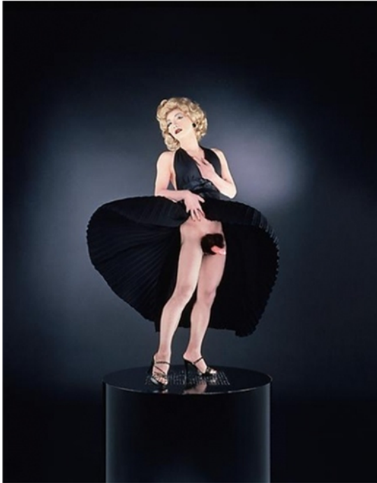
Figura 8. Yasumasa Morimura. "Black Marilyn". Fotografía análoga. 1996.

vemos al artista oriental exhibiendo un exagerado vello púbico y un falo erecto bajo la falda, como era usual, volándose al viento, la que él a su vez levanta un poco, al tiempo que se toca levemente un pecho. Sin embargo, en lugar de ver las formadas piernas de la joven, nos encontramos con los no disimulados miembros masculinos, por lo demás artificiales y exacerbados. Este gesto visibiliza la caricatura y la ironía paródica en torno a las problemáticas ya señaladas: el travestismo del cuerpo, la condición de feminidad, de masculinidad, la belleza, la sensualidad, el erotismo y sus estereotipos dentro de los marcos culturales, en este caso, occidentales.