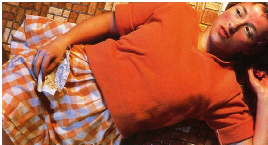
Figura 4. Cindy Sherman. " Untitled #96 ". Fotografía análoga. 1981.

No obstante, " Untitled #96 " (1981) de Cindy Sherman (fig.4), apela a otro tipo de montaje. En esta fotografía, tomada desde arriba y con formato apaisado, aparece Sherman disfrazada como una joven adolescente, tendida sobre el piso de una casa, con una posible carta en una de sus manos y mirando al fuera de campo, aparentemente reflexiva y nostálgica. Este tipo de imagen forma parte de la serie Centerfolds , en la que simula la fotografía cinematográfica, como si fuese un instante detenido dentro de un film. Mismo fenómeno ocurre con la serie Untitled film stills , donde vemos escenas ficticias, aunque inspiradas en la estética de directores como el británico Alfred Hitchcock (1899-1980), el cine negro y el neorealismo italiano. Las mujeres representadas en Centerfolds son víctimas del abuso masculino, de quienes las abandonan, las maltratan, etc.