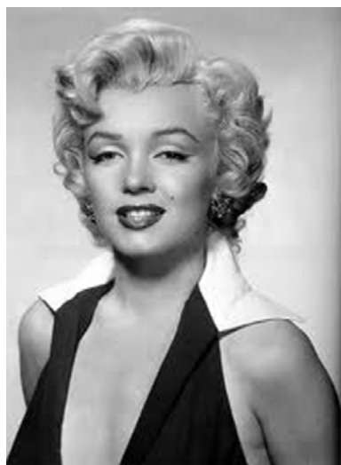
Figura 7. Retrato de Marilyn Monroe. Fotografía análoga. 1953.

Tales nociones quedan explícitamente expuestas en su obra "Black Marilyn" de 1996 (fig.8). Allí aparece Morimura ya no imitando a una foto puntual de Marilyn, pero sí su pose y su apariencia. Lo vemos de pie sobre un plinto, con un escotado traje y tacos, todo de color negro, inclusive el fondo. El concepto de feminidad, sensualidad y erotismo que portaba la actriz queda puesto en jaque cuando