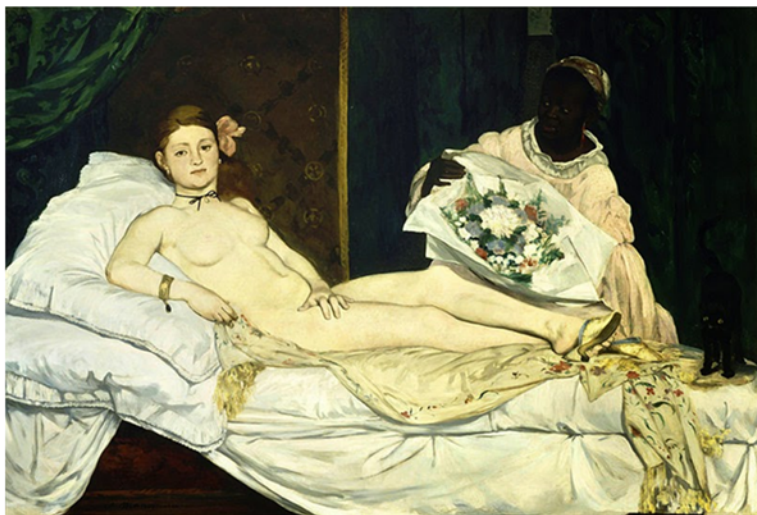
Figura 2. Edouard Manet. "Olympia". Óleo sobre tela. 1863.