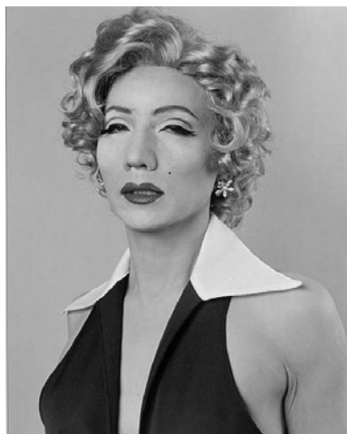
Figura 6. Yasumasa Morimura. "After Marilyn Monroe". Fotografía análoga. 1996.

a constructos culturales, variables siempre de acuerdo con el lugar y el contexto histórico.