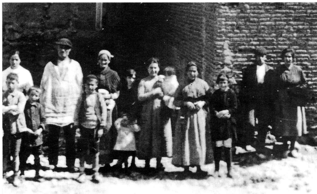
Una familia de labradores de comienzos de siglo.

ción de las élites propietarias le hacía introducirse de lleno en medio de las redes clientelares del municipio. En la concepción del poder del mismo se imponían los intereses de una oligarquía, cuya principal fuerza emanaba de las relaciones de dependencia y subordinación establecidas respecto al conjunto de la comunidad en base al control ejercido sobre la propiedad y la explotación de la tierra. 29 En este marco, el Gremio se transformaba en una extensión organizada del ejercicio del poder de los sectores propietarios, un organismo más de gestión de dependencias antiguas –acceso a recursos municipales– y nuevas –crédito, abonos– y, por extensión, de control