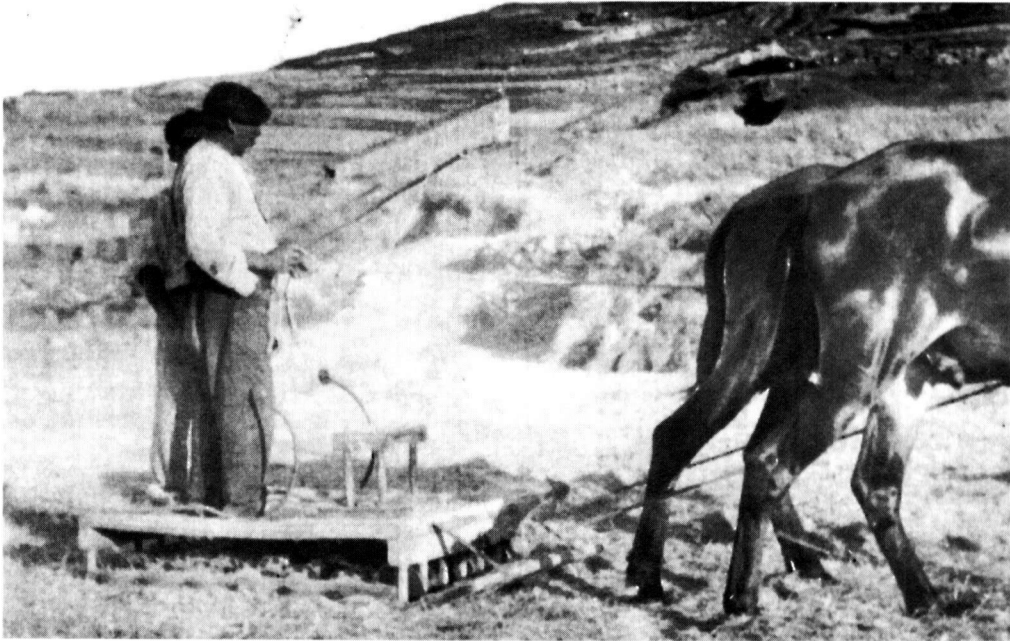
Labores agrícolas de trillado de la mies.

en 1906 de la organización católica representaría a uno de los centros de distribución de abonos en Tarazona, utilizando siempre la calidad de los mismos –verdadero problema, que generó tantas reglamentaciones sobre el comercio como infracciones a las mismas, y que hacía del análisis de los abonos otro de los aspectos centrales– como mecanismo de atracción para la comercialización del Gremio.