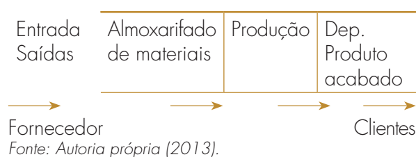
Figura 1. Fluxo de materiais.

Ao longo do processo produtivo (Figura 1) os materiais recebem acréscimos, transformações, adaptações, reduções, entre outros que vão mudando progressivamente suas características. Podendo assumir no fluxo o papel de materiais em processamento, semi-acabados, materiais acabados ou componentes, para então se completarem como produto acabado (PA), conforme Figura 2.