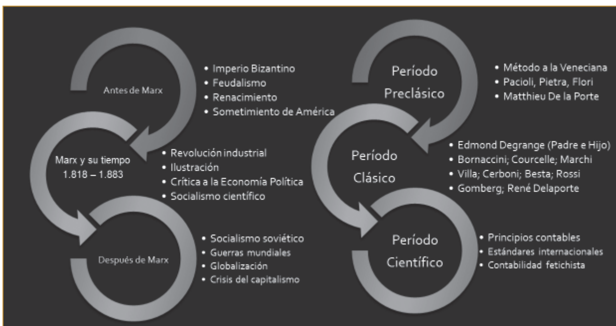
Ilustración 1. La doctrina marxista en el marco de la evolución contable.

En la reflexión sobre la evolución de la disciplina contable seguimos con modificación a Requena (1981), quien propone tres períodos: empírico, clásico y científico. Al respecto se considera que se da un período preclásico que comienza con el método a la veneciana. El siguiente gráfico sirve como guía ilustrativa del análisis propuesto.