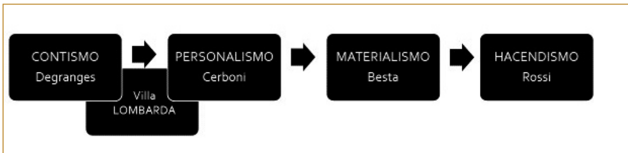
Ilustración 2. Período clásico de la contabilidad 1795 - 1920.