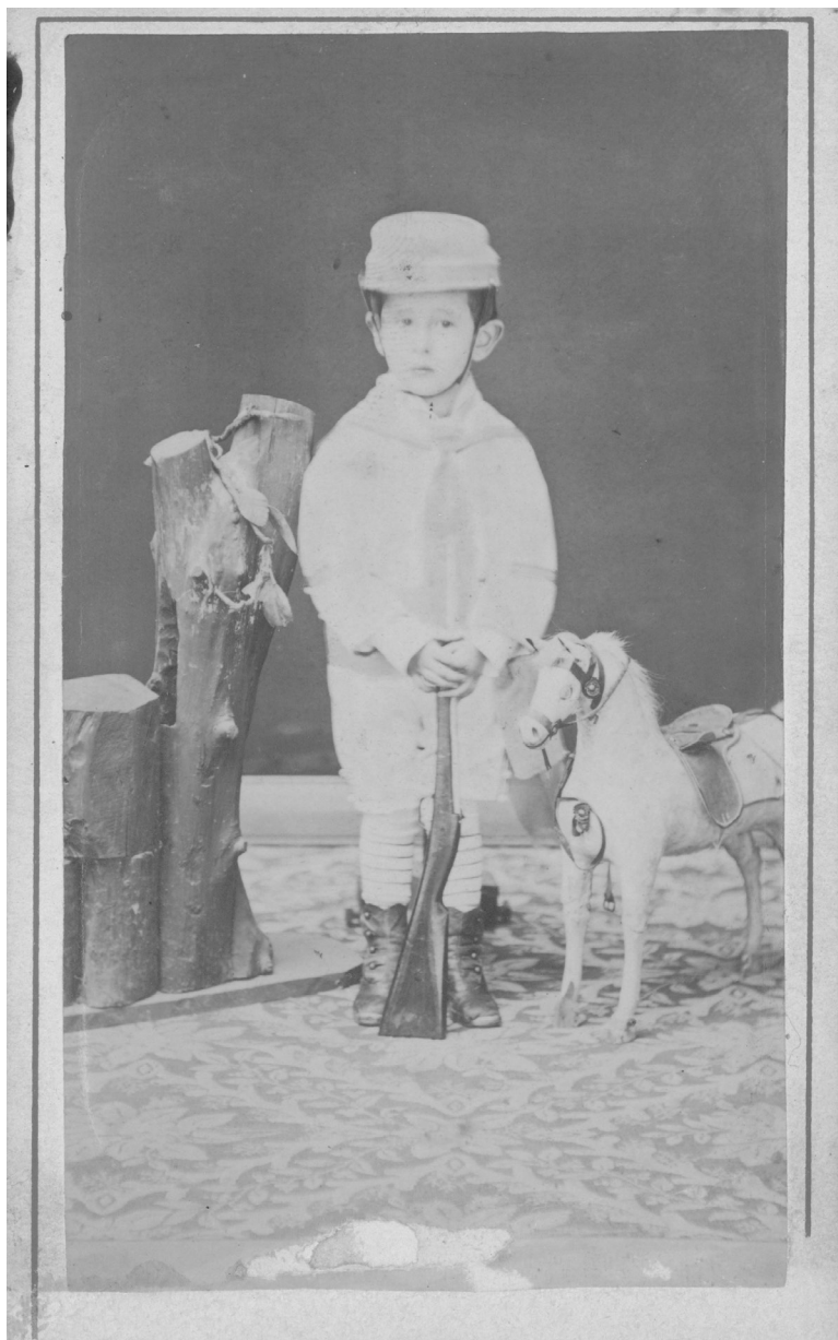
Imagen 1. Retrato de Alfredo Santa Cruz, 1899. Museo Histórico Nacional.