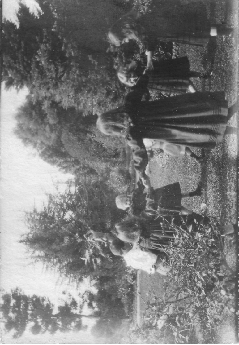
Imagen 5. Ronda en Panquehue, abril de 1900.