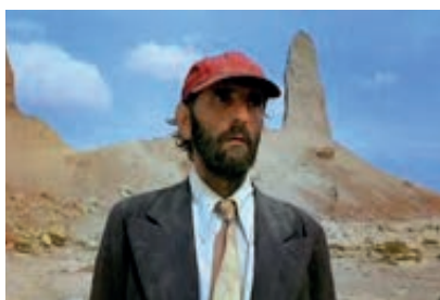
Fotograma 1. Travis en el desierto de Texas.

Frente a la displicencia que manifiesta Odiseo en la epopeya homérica por su condición errante, por la cólera de un dios que determina la motivación forzosa de su viaje (Gómez Espelosín, 2000), el nuevo Odiseo perfilado por Wenders se alza como viajero que decide vagar sin rumbo, quizá como penitencia ante un pasado doloroso, como medio de purgar su alma en las vastas llanuras del desierto. A este respecto, en El acto de ver Wenders reflexionó sobre el desierto como un medio para alejarse de la vida