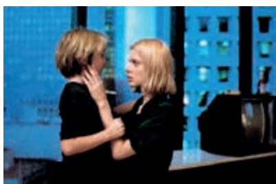
Fotograma 8. El reencuentro de Jane con su hijo.

París, Texas se cierra con el reencuentro entre Jane y su hijo en el Hotel Meridien, habitación 1520. El niño abraza a su madre. Ella, con el pelo mojado, vive la emoción del reencuentro en una escena de soledad ciertamente enigmática. Luego de haber cumplido su destino, Travis (que espera fuera del hotel) se monta en el coche y se va, pues no hay Ítaca posible. Simboliza entonces al viajero eterno que de nuevo emprende el viaje, quién sabe hacia qué lugar; se alza como el viajero errante, el de las Ítacas perdidas, en una actualización del mito clásico de Odiseo en el escenario que ofrece el desierto de Texas. Se trata, pues, de un hombre cansado, falto de vitalidad, que es consciente de su sentido de la derrota. Su viaje no es más que un ajuste de cuentas con la realidad, el acto de desandar el camino y retrotraerse al pasado para saldar la deuda con su esposa y con su hijo. Es un reencuentro que no se va a