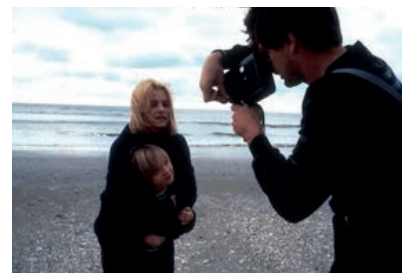
Fotograma 3. Una vida en imágenes: recuerdos, fotografías.

En París, Texas , la memoria se construye en dos niveles generacionales: del padre al hijo (Travis y Hunter) y del hijo al padre (Travis y su innominado progenitor), a través nuevamente del artificio intemporal de la imagen fijada en la fotografía. Por ello Travis mira fotos de su difunto padre. Mediante la visualización de imágenes pretéritas, padre e hijo construyen una memoria familiar. El hijo pregunta si teme que esté muerto, pero el hijo le confiesa que nunca pensó que su padre hubiera muerto: simplemente caminaba. El hijo considera a Travis como un auténtico viajero cuyo destino no es sino vagar sin rumbo, aventurarse en nuevas tierras plagadas de fantasía y realidad. En una línea de fuerza de gran pujanza, en el imaginario del pequeño Hunter resplandece la influencia del cine de Star Wars en los años ochenta, películas que visualizaban los jóvenes de aquella época y en las que se muestra una auténtica fascinación por la galaxia, el universo, el espacio. También en este nivel de la intrahistoria se forja un viaje galáctico y espacial con el que el pequeño Hunter sueña, esperando quizá lograr llegar a su Ítaca.