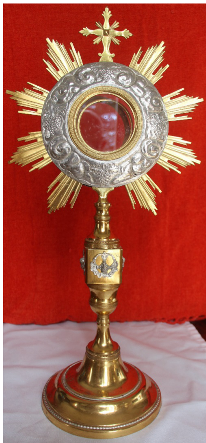
Foto 3 y 4. Cáliz de Buendía y custodia de Villalgordo del Marquesado.