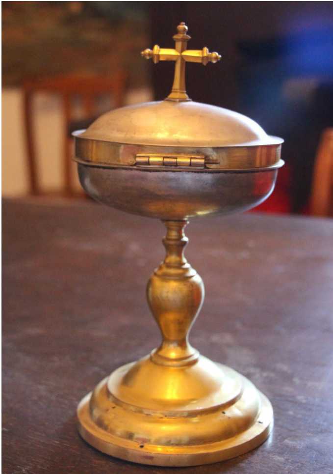
Foto 7. Copón de El Cañavate.

Un copón idéntico se encuentra en Pareja, aunque a este le falta la cruz. Sin embargo están presentes los dos contarios del pie 27 . Este tipo de copón es bastante común en la época.