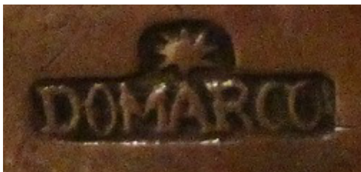
Foto 1. Marca en el cáliz de Buendía.