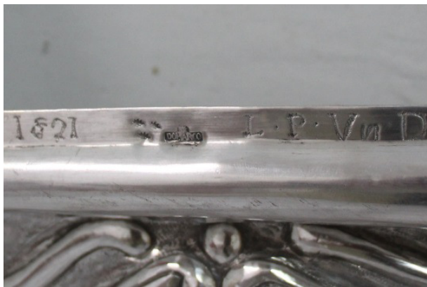
Foto 10. Detalle del marco.