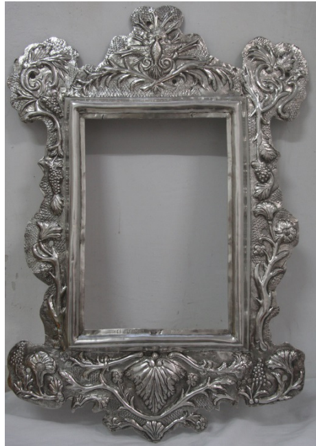
Fotos 8 y 9. Retablo y marco de plata.