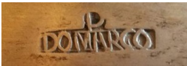
Foto 2. Marca en el copón de El Cañavate.

Hemos encontrado documentación probable en el Libro de Cuentas de Fábrica de la Parroquia de N a S a de la Asunción de El Cañavate, un asiento del pago al platero (falta el nombre) por las obras realizadas en 1837. Al citar las obras, coinciden con las que llevan su marca 25 .