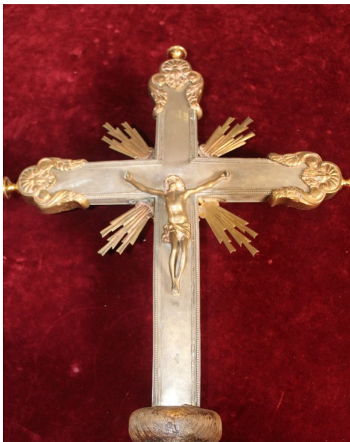
Foto 5 y 6. Incensario de Huete y cruz de Villalgordo del Marquesado.