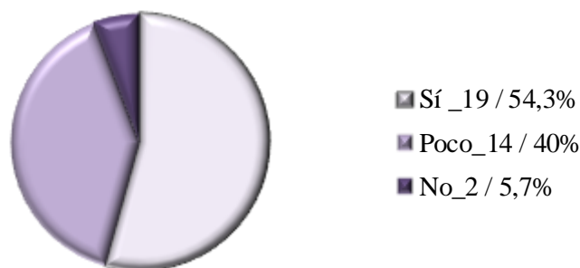
Gráfico 2. Resultados de la encuesta a la siguiente pregunta: ¿Habías oído hablar del origen del problema de la violencia de género, según lo hemos tratado en la asignatura, antes de cursar la misma?