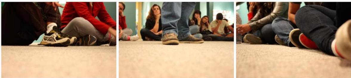
Figura 3: Foto-Ensaio - Espaço educativo: o museu

Nesse sentido, Marin Viadel e Roldán (2012) questionam como ver (literalmente) melhor os problemas educacionais; como olhamos (visualmente) esses problemas e como podemos imaginar novas soluções educacionais para o pleno desenvolvimento pessoal e social. Para esses autores, “uma pesquisa educacional baseada na fotografia é aquela que utiliza imagens e os processos fotográficos para indagar sobre os problemas relacionados com o ensino e a aprendizagem” (2012, p. 42).