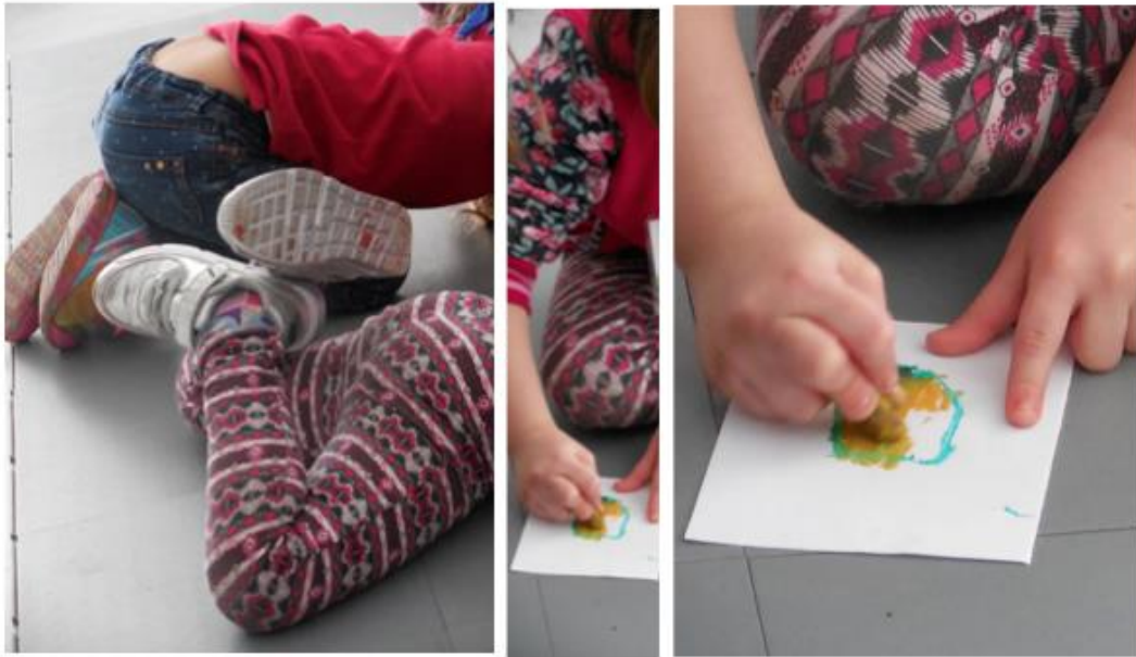
Figura 2: Foto-Ensaio - O corpo que desenha

Fonte: Acervo pessoal - Composto por duas fotografias digitais