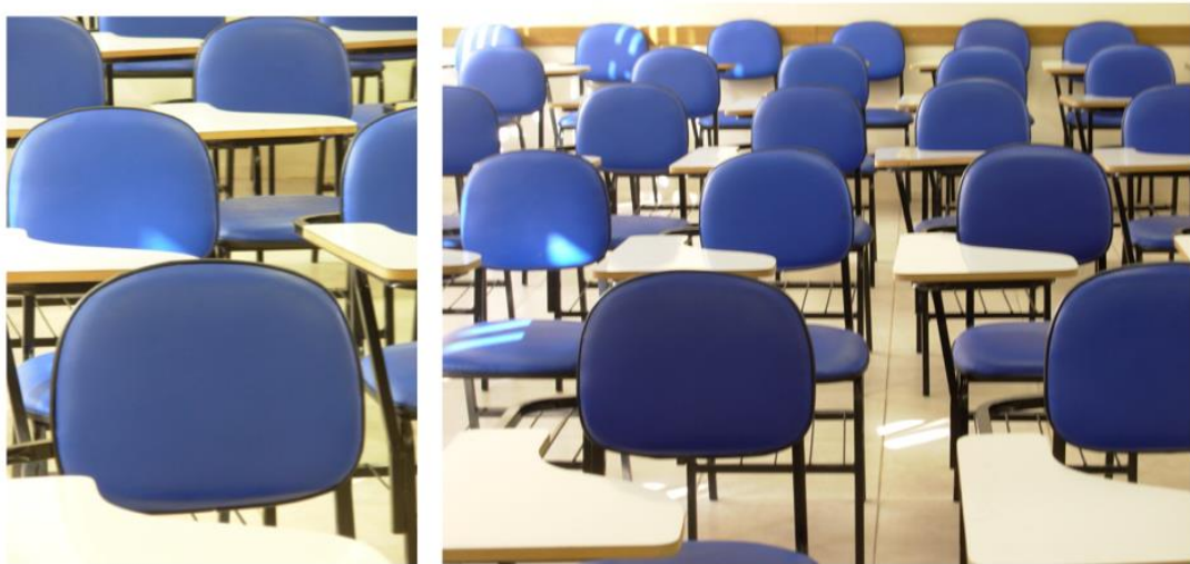
Figura 5: Foto-Ensaio - Espaço educativo: a sala de aula.

Ao selecionar os instrumentos visuais da pesquisa, precisamos considerar quais são os elementos do nosso interesse. Quais as variáveis e como podem ser arranjadas, quais as estratégias úteis e por fim, qual a técnica fotográfica mais adequada. Então, a utilização da fotografia na pesquisa pressupõe tomar decisões sobre: 1) o referente (objeto de pesquisa); 2) como fazer (quais as ações, em qual tempo, etc.); 3) contexto visual (onde, como); 4) revelar visualmente sua mirada de pesquisador e, 5) colocar em dúvida aquilo que vê (ponto de vista crítico).