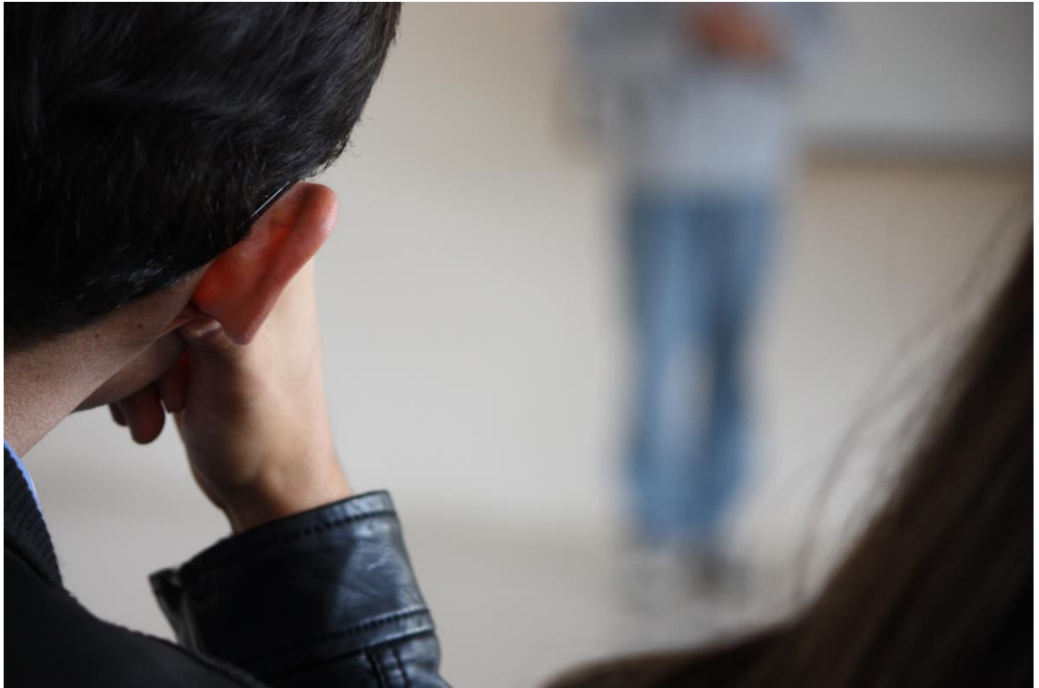
Figura 4: Foto-Ensaio - Espaço educativo: a aula

objetivos se apliquem à resolução ou planejamento de problemas no campo da educação. [...] O que caracteriza o trabalho das pesquisas fotográficas é precisamente que trabalham a descrição, a análise e a geração de novas situações que possam ser vistas de outro ângulo. (ROLDÁN. 2012, p. 56).