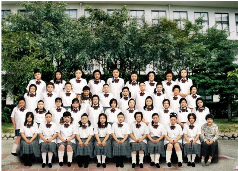
Figura 1: Citação visual literal