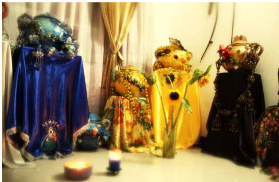
Figura 1. Altar para los orichas

Fuente: Luis Carlos Castro Ramírez, Cali, 23 de abril de 2012.