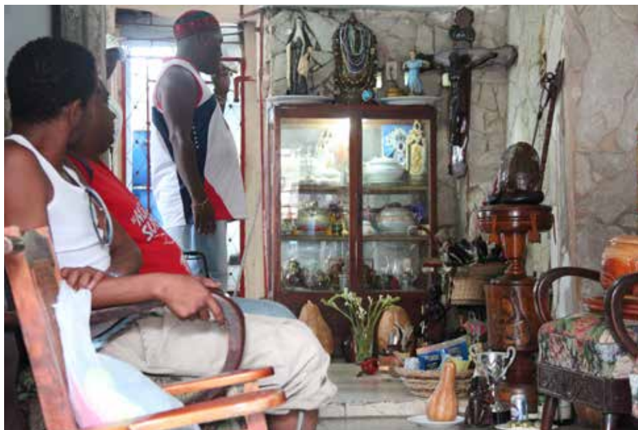
Figura 2. Visita a los orichas en el oriente cubano