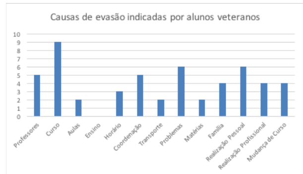
Gráfico 3- Causas de evasão indicadas por alunos veteranos.

Foi possível constatar que, o estudo relativo a evasão não deve se encerrar por