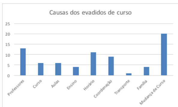
Gráfico 1- Matriz resultante entre os evadidos e a evasão de curso.

Ao longo da discussão dos resultados, utilizaremos o termo unidade de referência com unidades de registro. Apresentamos no Gráfico 1, a matriz resultante das unidades de referência dos vários indicadores na triangulação entre os evadidos e mudança de curso.