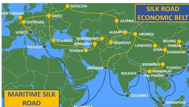
Figura 1. La ruta de la seda.

Las repúblicas de Asia Central están incluidas en la de la parte terrestre de este plan, y tienen tres rutas previstas: «la ruta norte, de unos 6.500 kilómetros de longitud, que parte de Urumqui (China) y pasa por Alashankou-Dostyk (Kazajistán), por Kazán–Moscú–Brest (Rusia) y llega a los países de la UE; la ruta central, de unos 5.100 kilómetros, con origen en la parte central de china y atraviesa Kirguistán, Uzbekistán, Turkmenistán, Azerbaiyán y Georgia para pasar de ahí a la Unión Europea; y la ruta del sur, que parte de la región de Sinkiang y pasa por Kirguistán, Uzbekistán, Turkmenistán e Irán para llegar a Turquía, en cuya ruta se incluye el corredor económico de Pakistán hasta el puerto de Gwadar. A partir de Kazajistán, las tres rutas se expanden hasta Europa» 20 .