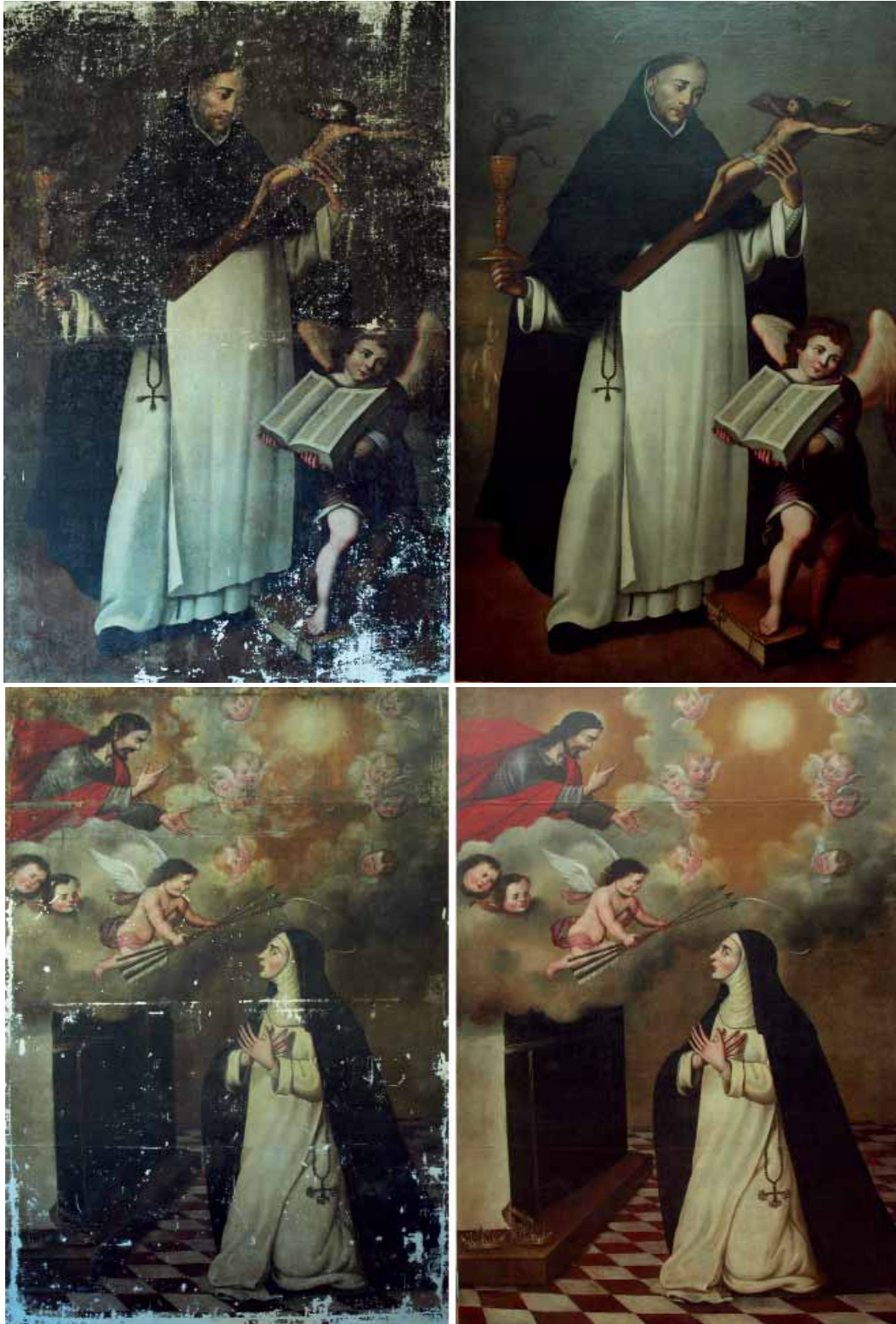
ANTES Y DESPUÉS DE LA INTERVENCIÓN. SAN LUIS BELTRÁN Y SANTA MARGARITA DE HUNGRÍA.

Por último, cabe destacar que, a pesar de la gran cantidad de lagunas, se han podido completar y reconstruir cada una de las imágenes, ya que la información procedente de las zonas circundantes a éstas fue suficiente para la obtención de estos resultados.