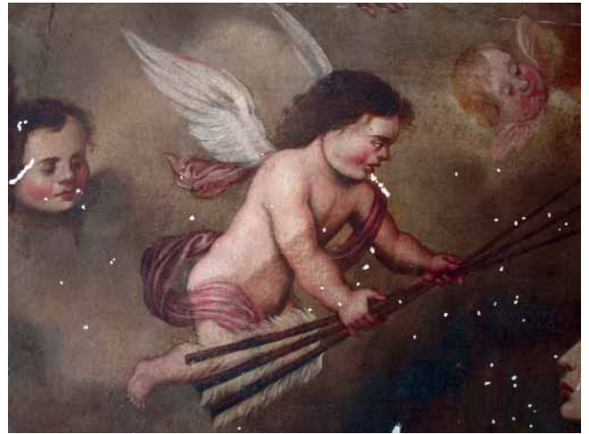
DETALLE DEL PROCESO DE LIMPIEZA MEDIANTE GEL ACUOSO.