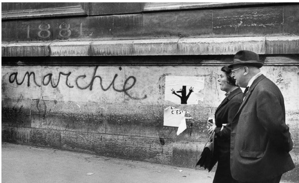
Figura 06. Graffiti "anarchie". Francia (1968). Autoría: Marc Riboud.