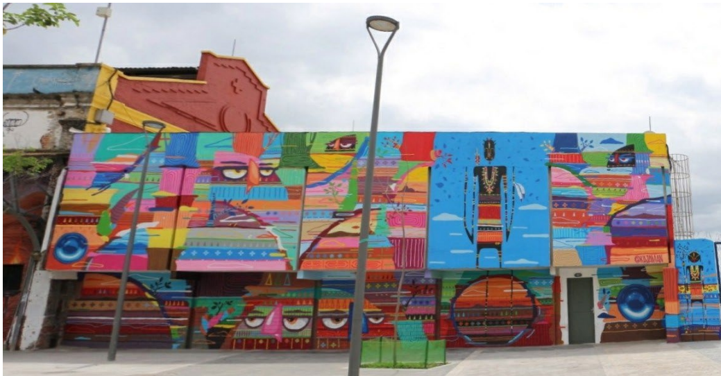
Figura 01. Graffiti Kajaman (2016). Boulevard Olímpico, Río de Janeiro. Autoría: Aline Oliveira.

Aunque la función transgresora e innovadora del arte no puede ser controlada, ha sido creciente el número de iniciativas oficiales que estimulan la producción artística en el espacio público. En este caso, presentaremos la galería de arte a cielo abierto creada en el Boulevard Olímpico, porque creemos que ella nos ayudará a reflexionar, de manera más evidente y menos contradictoria, el interés de las iniciativas institucionales por la práctica del graffiti . Este artículo tiene por objetivo buscar comprender las funciones que esta práctica cumple para las instituciones, al transformar el ambiente social y cultural de una región urbana.