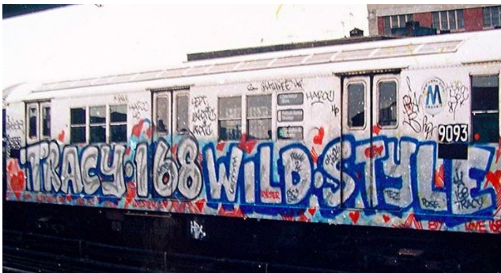
Figura 07. Graffiti Tracy 168 en el subterráneo de Nueva York (1970). Nueva York, Estados Unidos. Autoría: Desconocido.