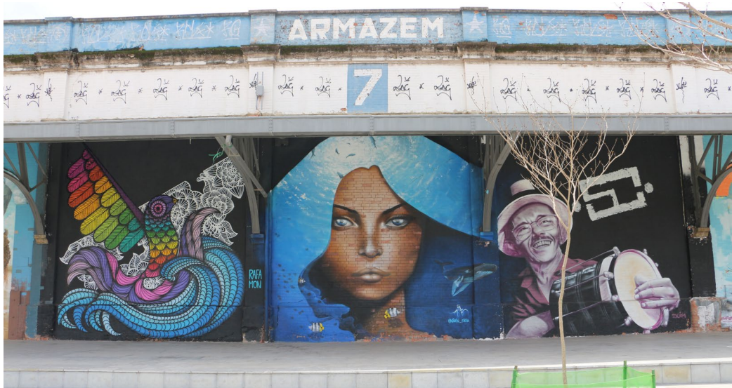
Figura 09. Graffiti GaleRio, Rafa Mon, Gilzin Faria, Duim (2016). Boulevard Olímpico, Río de Janeiro. Autoría: Aline Oliveira.

la sociedad que busca soluciones para el desarrollo socioeconómico y cultural de la ciudad. (RIO DE JANEIRO – RJ, 2013).