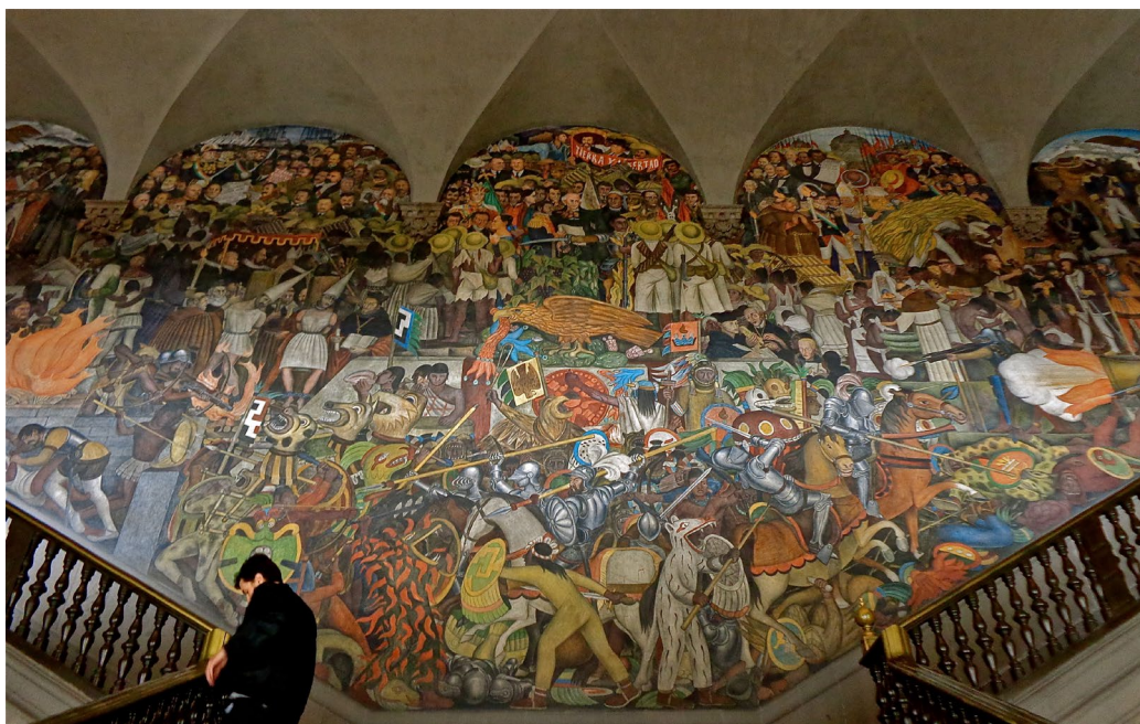
Figura 05. Mural en el National Palace, Diego Rivera (1929- 1935). Ciudad de México, México.

mexicano. Fundamentado en el principio de que el arte debe tener alcance social y ser accesible al pueblo, los artistas optaron por la producción de murales en lugares públicos, rompiendo con los círculos restringidos a las galerías, museos y colecciones particulares.