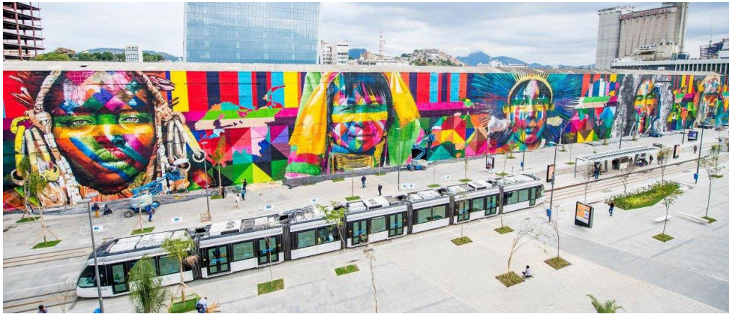
Figura 04. Mural Etnias – Todos somos uno, Eduardo Kobra (2016). Boulevard Olímpico, Río de Janeiro. Autoría: Paulo Múmia.

de los años 1960 8 y popularizándose en las ciudades europeas y americanas, en la segunda mitad de los años 1980, impulsadas por las políticas públicas de la cultura.