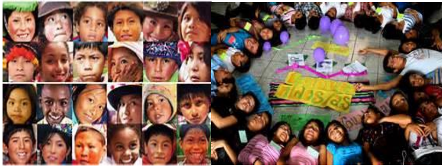
Figuras 4 y 5. Niños de diferentes países de América Latina (Google, s.f.)

En muchas naciones latinoamericanas la diversidad de lenguas y culturas ha sido vivida como una problemática que se tiene que “arreglar, componer, superar” para de esta manera poder “avanzar/progresar” lo cual me hace pensar en las tres orientaciones que Ruiz (1984 citado en De Jong, 2011) utiliza para describir la visiones sobre la diversidad lingüística: la lengua como un problema, como un derecho y como un recurso. Siendo la primera orientación la que ha dominado en algunas sociedades ya que se ha tenido la idea de que privilegiar a la lengua y a la cultura de la mayoría da como resultado una sociedad unida. La fórmula errónea es la siguiente: