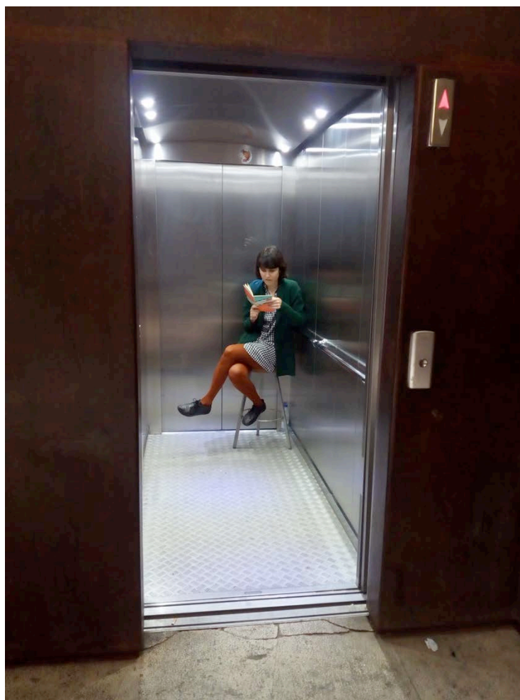
Imagen 2. Leyendo Caminar de H. D. Thoreau en el Ascensor.

PRIMERA CONEXIÓN: MOVIMIENTO. El ascensor donde realicé la acción está situado justo al lado de La Escalinata neo-mudéjar en Teruel. Por lo tanto, si decidimos salvar el desnivel existente entre los jardines de la estación de tren y la zona del Óvalo, en el centro de la ciudad, tenemos dos opciones. Una opción sería subir La Escalinata a pie y la otra consiste en utilizar el ascensor público. Realizar la lectura de Caminar dentro del ascensor supone activar un juego de opuestos entre la idea de movimiento horizontal (caminar) frente a la idea de movimiento vertical (elevarse automáticamente).