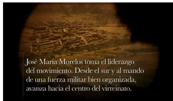
Figura 4: Cuautla vista desde el catalejo de Calleja.

El mismo catalejo se vuelve testigo de la condición miserable de Cuautla, a la vez que evidencia el espacio considerado heroico en la historiografía nacionalista (ver Figura 4). Un ángulo picado minimiza la población, resaltando la valentía del héroe por haberlo utilizado como refugio. El marcador de tiempo nos indica que es el “Día cero” (de los 72 que dura el asedio). La risa despectiva de Calleja, enemigo principal de los insurgentes, evidencia una burla a la pericia militar de Morelos. Con su propio catalejo, desde el refugio de una enramada, Morelos atestigua la presencia de los realistas. En este rejuego visual se establecen las condiciones de la oposición, un ejército realista que ve con desprecio al enemigo y su refugio, quedará humillado por los insurrectos.