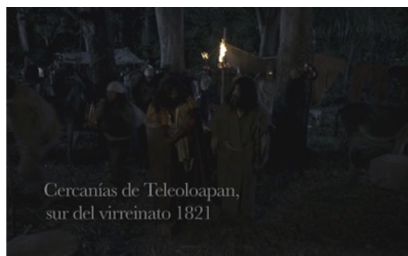
Figura 1: Capítulo "La patria es primero".

informa que lo narrado no ocurre en un espacio vago, sino en un lugar específico del actual Estado de Guerrero, donde se libraron las luchas más largas de la independencia, en un tiempo en el que estaba a punto de terminar la guerra (1821). Con ello, la producción de la serie situó el proceso en una geografía específica.