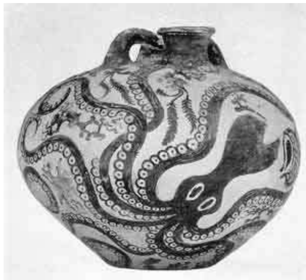
IMAGEN 3: VASO DE KAMARÉS CON MOTIVO DE PULPO, H. XX – XVIII A.C

Con el colapso de la civilización micénica, el reencuentro con el mar y con el comercio marítimo tendría que esperar, dice Courvisier, hasta el siglo IX. Hasta hace poco se daba por verdadera la famosa invasión dórica que habría acabado con la micénica, la entrada en la Edad Oscura, pero