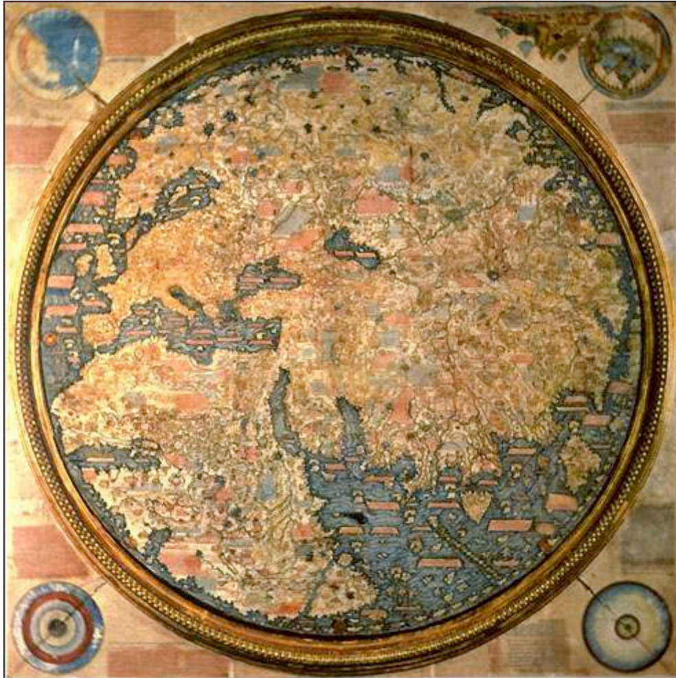
IMAGEN 2: MAPA DE FRA MAURO: 1459