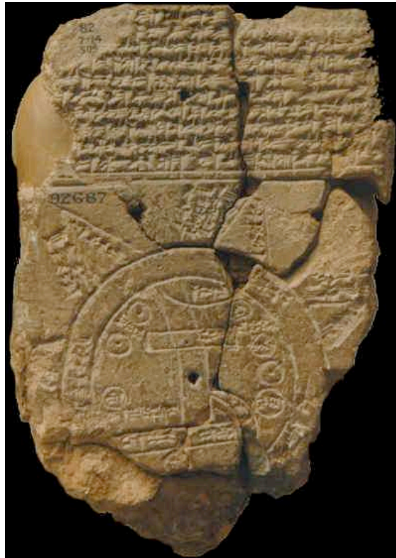
IMAGEN 1: MAPA BABILÓNICO