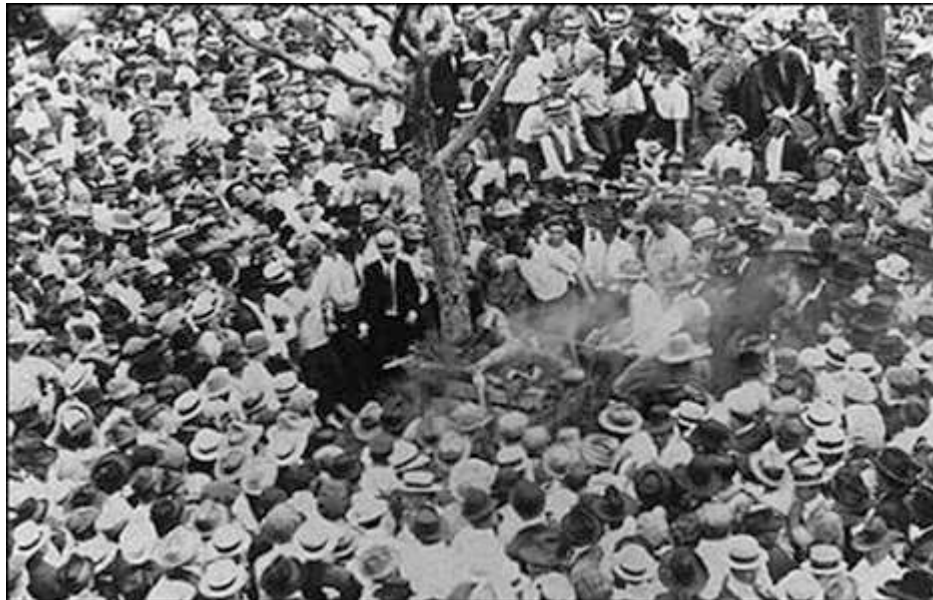
IMAGEN 1: LINCHAMIENTO DE JESSE WASHINGTON

que acabamos de ver. Cambia, eso sí, a nivel antropológico, la participación directa de la turba, de la gente enardecida del pueblo y su contacto con el cuerpo del condenado, en una escena sacrificial, casi girardiana del chivo expiatorio. Ahora bien, además de este matiz que no suele encontrarse en el teatro del suplicio (cuya escena punitiva viene pautada, paso a paso y de forma meticulosa, por lo que dicta la fuerza de la ley y la violencia es ejercida con exclusividad por la figura del verdugo) hay un elemento fundamental que va a hacer la escena de Waco radicalmente distinta. Una vez más, se trata de una cuestión de iluminación. El suplicio de Washington fue capturado, casi por completo, por el ojo indiscreto y testimonial de una cámara de fotos. Las fotografías, tomadas ese fatídico día de mayo, forman parte del horror que allí se vivió. En algunas de ellas, vemos a la masa alrededor del condenado, rodeando el cuerpo de Washington y el árbol al que fue atado.