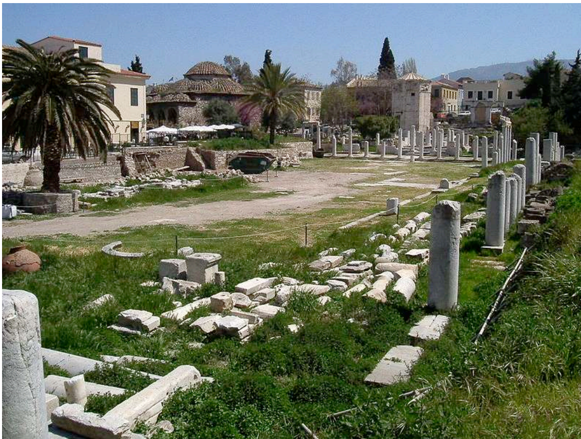
IMAGEN 4: ÁGORA ROMANA DE ATENAS

adentro de ese afuera, o en el templo. En el caso de Atenas, dentro del ágora, atrapado, al lado de todas instituciones políticas. Si por ejemplo echamos un vistazo al ágora romana de Atenas, sorprende que dedicasen todas esas columnas, esa belleza, para una acción tan innoble como el mercadeo, la venta de comida hecha y despojos dentro de esa especie de templo... El templo, lo religioso, como he dicho, está ahí para impedir que los dioses o que el mercado y sus flujos salpiquen el mundo profano, es decir, que el deseo pueda flotar libremente. Lo religioso es lo que encadena al bicho y lo deja salir en las festividades canalizado en ritos adecuados. El capitalismo no pudo haber nacido en Atenas por la sencilla razón de que inventaron el derecho y la política, que es lo que suplió al mundo religioso a la hora de codificar el deseo. Habría que preguntarse si el invento del derecho es lo que impide en esos momentos que el todavía-no-capitalismo abra las compuertas de los flujos.