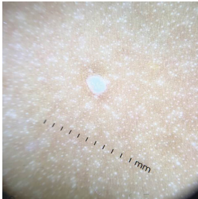
Figura 04: Dermatoscopia: Piel de tronco con máculas acrómicas puntiformes en patrón confeti