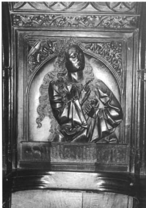
1. Oviedo. Catedral. Capilla del Rey Casto. Virgen del Parteluz.-2. León. Catedral. Sillería. Respaldo bajo. Sibila Tiburtina.