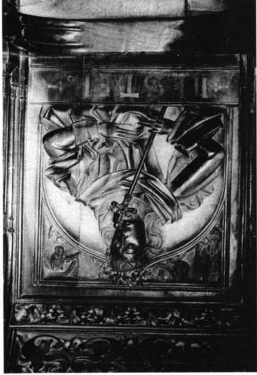
León. Catedral. Sillería.-1. Respaldo alto. Adán y Eva.-2. Respaldo bajo. Ester.