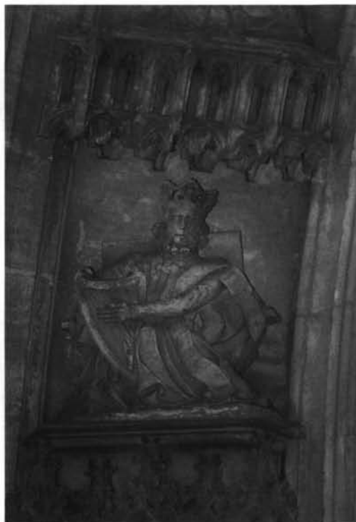
1. León. Catedral. Sillería. Panel del testero derecho. David en el Arbol de Jessé.—2. Oviedo. catedral. Capilla del Rey Casto. Arquivolta exterior izquierda. David.