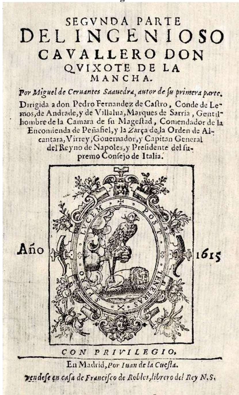
Portada de la Primera Edición de la Segunda Parte del Ingenioso Caballero Don Quijote de la Mancha (1615), de Miguel de Cervantes (1547-1616). Imprenta de Juan de la Cuesta, Madrid, España.