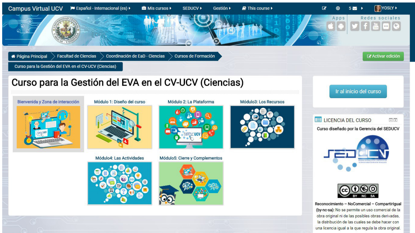
Figura 3. Curso gestión del entorno virtual de aprendizaje en el campus virtual

Ahora bien, el caso actual de la UCV es que su oferta en modalidad a distancia está constituida, en su mayoría, por asignaturas de diferentes programas de pregrado y postgrado. Sin menoscabo de este criterio, se cree que el estatus en referencia se concrete efectivamente cuando la oferta de estudios presenciales tiene un correlato en la oferta de estudios a distancia, es decir, esta se nutre en una proporción significativa de planes de formación en pregrado, postgrado y educación continua, equivalente a la oferta presencial que posibilita a la población demandante de