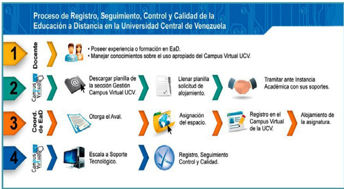
Figura 2. Diagrama de procedimientos del RSCC [13].

El SEDUCV provee un plan de formación y capacitación de docentes en materia de EaD y uso del campus virtual UCV, el cual se mantiene en permanente revisión y actualización. Desde finales de 2014, se estableció una estrategia de cursos de inducción al nuevo campus virtual dictados en modalidad mixta, para apoyar el proceso de migración a esa plataforma; actualmente, se promueven dos cursos en línea: “Gestión del Entorno Virtual de Aprendizaje en el Campus Virtual UCV” y “Bloques de la Plataforma Campus Virtual UCV”, los cuales se caracterizan por ser autogestionados por los docentes participantes con base en el tiempo de cada uno. Por otro lado, tienen como propósito apoyar el proceso de formación de los profesores de la UCV en el uso del