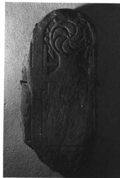
Grupo II, taller A (n° 6, 11 y 16, G.II).