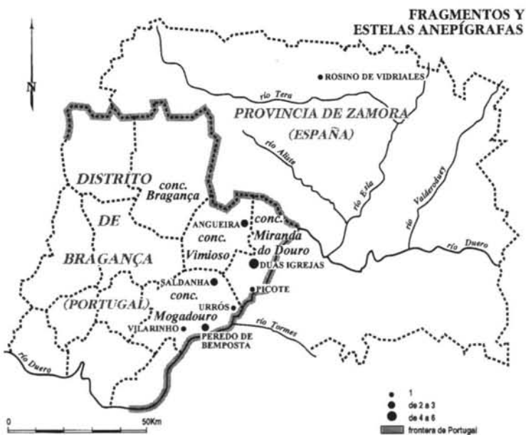
Fig. 2. Mapas de distribución. Los mapas han sido realizados por el servicio cartográfico del Instituto Ausonius (IRAM), Université Michel de Montaigne-Bordeaux III, Francia.