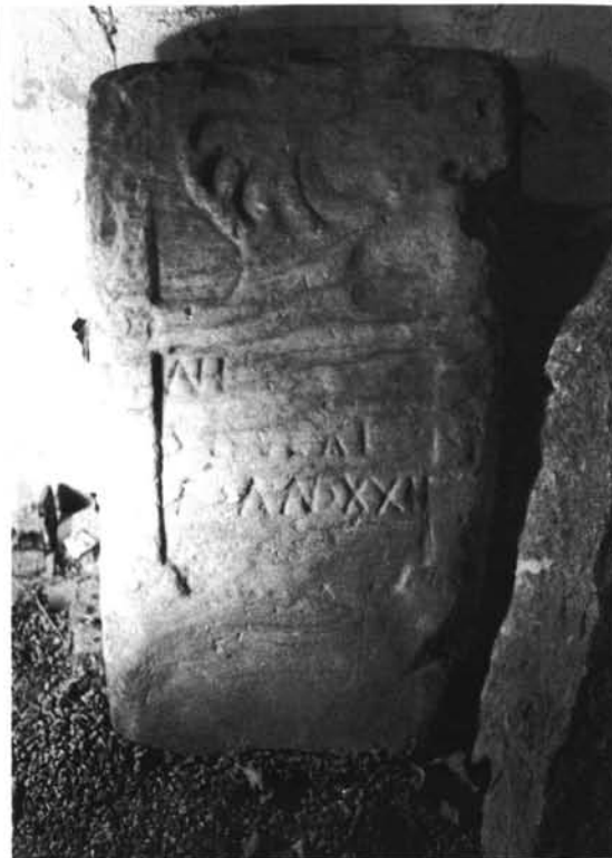
2. Grupo I, taller B (n.º 7, G. I)