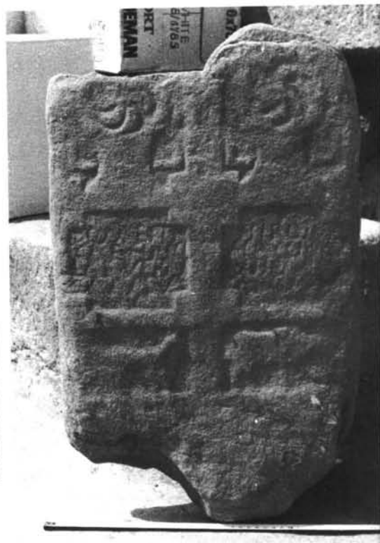
Grupo I, taller C (n° 1, 2 y 15, G.I).