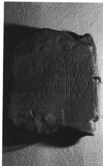
1 y 2. Grupo II, taller B (n.º 1 y 2, G. II). 3. Grupo II, taller C (n.º 13, G.II).