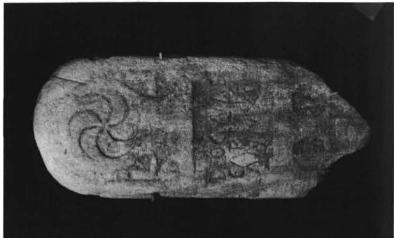
Grupo I, taller D (n° 10, 16 y 19, G.D).