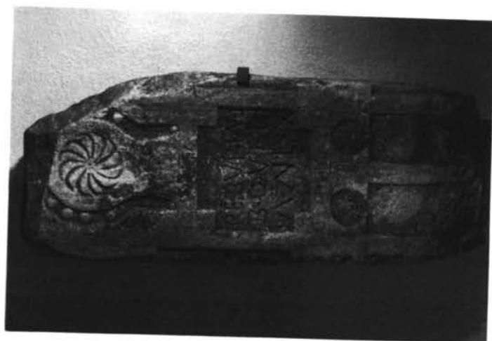
Grupo I, taller A (n° 12, 9 y 11, G.D).