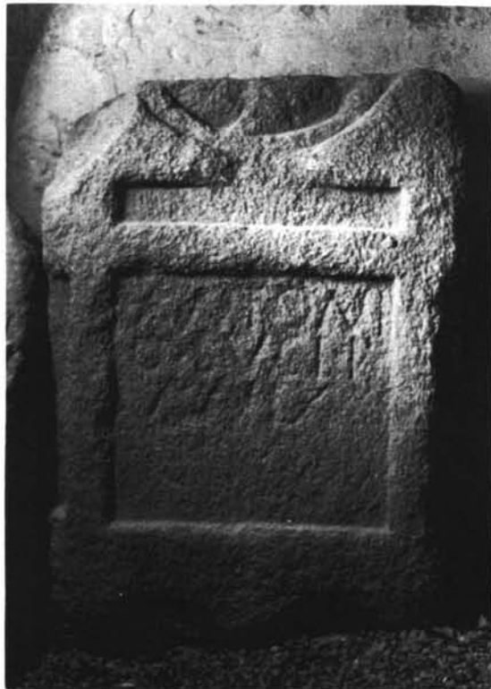
1. Estela de granito procedente de Duas Igrejas.