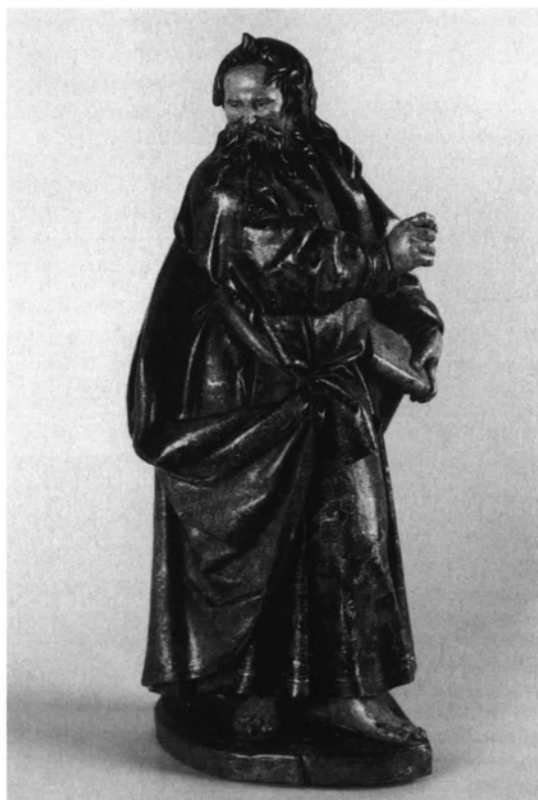
1. Valladolid. Santuario Nacional de la Gran Promesa. La Virgen, Santa Ana y el Niño (detalle). 2. San Pablo.