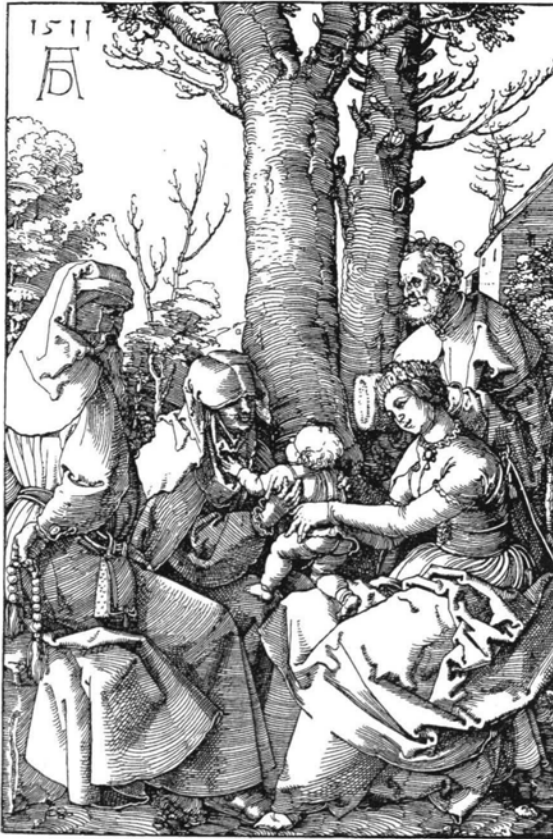
1. Valladolid. Santuario. Nacional de la Gran Promesa, La Virgen, Santa Ana y el Niño. 2. Dürero. La Sagrada Familia, San Joaquín y Santa Ana. Xilografía.