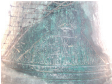
Fig 23.- Sinete o marca de fábrica da campá superior do oco do nacente elaborada por Palacio en 1868.