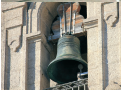
Fig 14 e 15.- Campá mediana no frontal da torre dereita. Na figura superior, a marca de fábrica de José Cabrillo Mayor e na figura inferior, vista xeral.