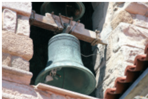
Fig 22.- Campá situada no oco do nacente da torre na parte inferior do mesmo.

No «terzo» (T) está decorada cunha cenefa de triángulos con estrelas no seu interior. Séguenlle dous cordóns e a inscrición seguinte: «(Vieira) IHS (vieira) MARIA (vieira) Y