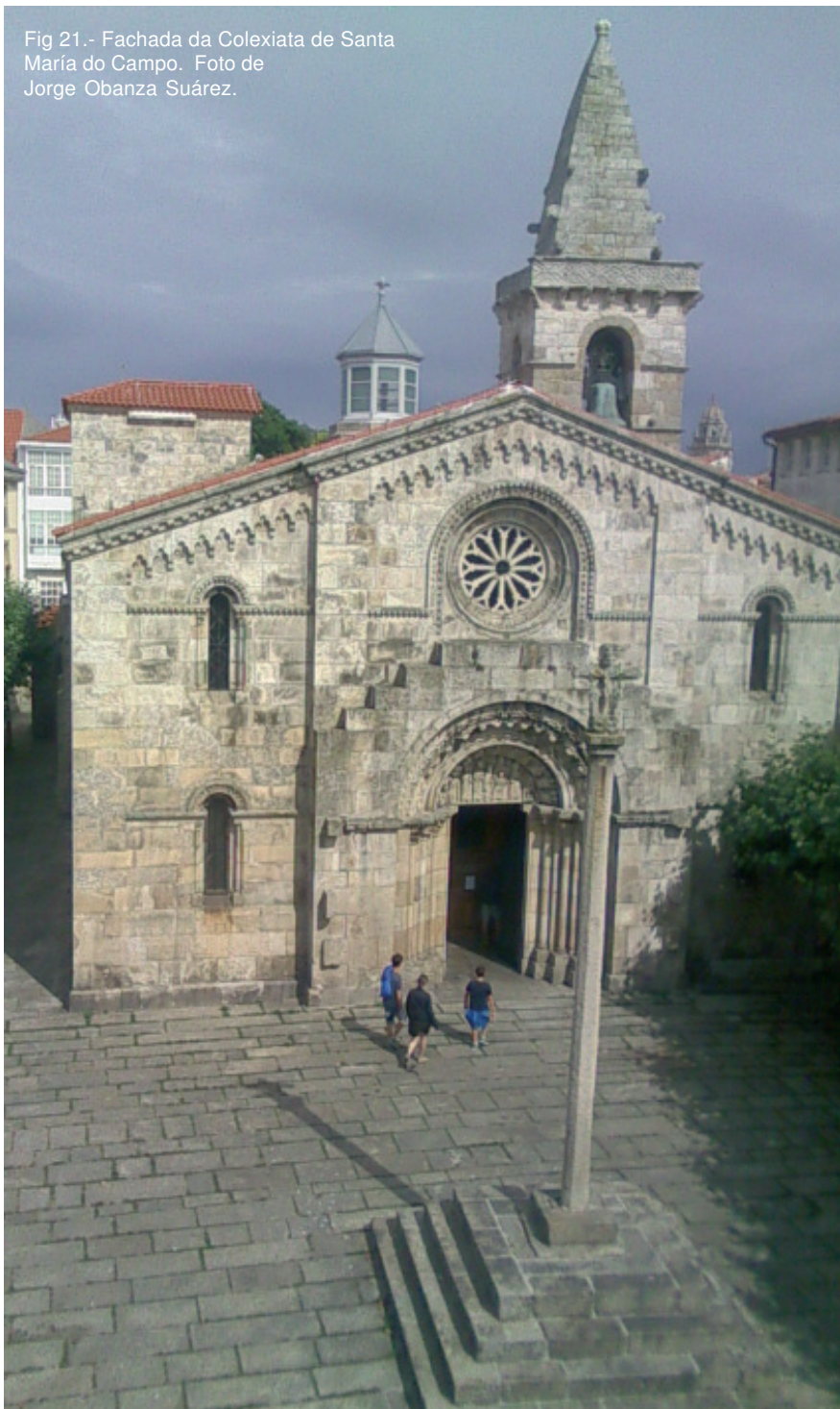
Fig 21.- Fachada da Colexiata de Santa María do Campo.