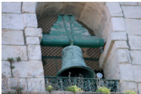
Fig 7.- Campá pequena situada na traseira da torre-campanario da parroquia de Santiago da Coruña, feita por Palacio e Liste.

Como comprobamos polas datas das campás, a saga familiar dos Palacio perdurou, como mínimo 144 anos, os que van da campá Mariana da catedral de Lugo, de 1719, á