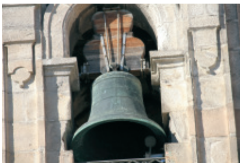
Fig 11.- Campá grande no frontal da torre esquerda da igrexa de san Xurxo da Coruña.