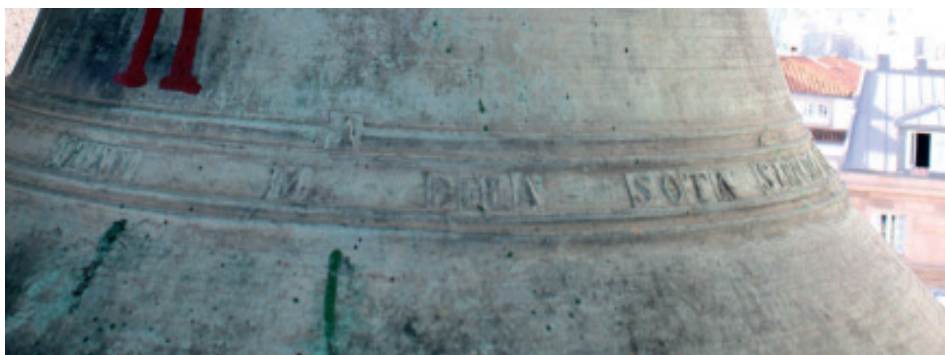
Fig 6.- O sinete (marca de fábrica) co nome de Juan M. de la Sota na campá do oco esquerdo da torre.

A última campá da igrexa de Santiago da Coruña é a nº 3, na contraria ao frontal, que conta cunhas medidas de 70 cm de diámetro e 60 cm de alto interior. O seu peso é duns 199 kg. de peso.