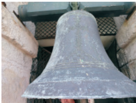
Fig 2.- Campá mediana situada no frontal da torre-campanario da parroquia de Santiago da Coruña.