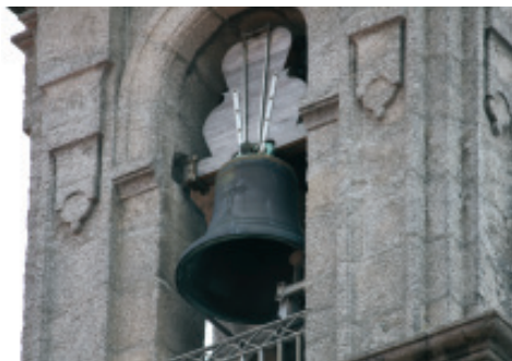
Fig 16.- Campá grande situada no oco norte da torre dereita de san Xurxo feita por José Cabrillo.