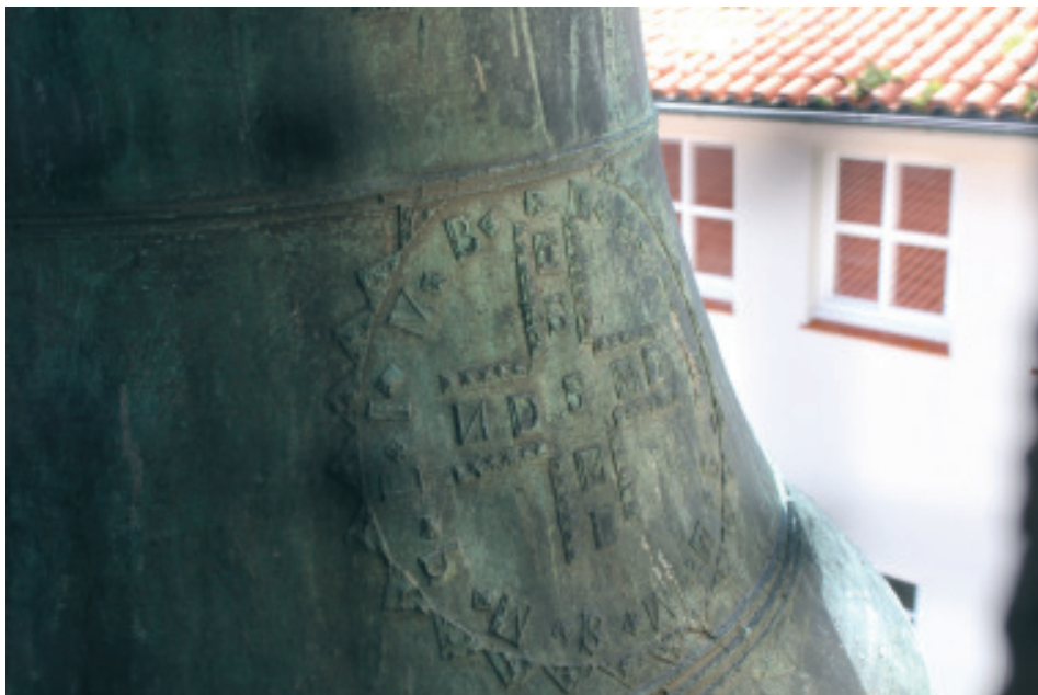
Fig 24.- Campá situada no oco sur da torre da Colexiata de Santa María do Campo elaborada no 1773.

JOSEPH (vieira) ORATE (vieira) ORA PRONOBIS (vieira) ANO DE 1773». A continuación, séguenlle outros dous cordóns.