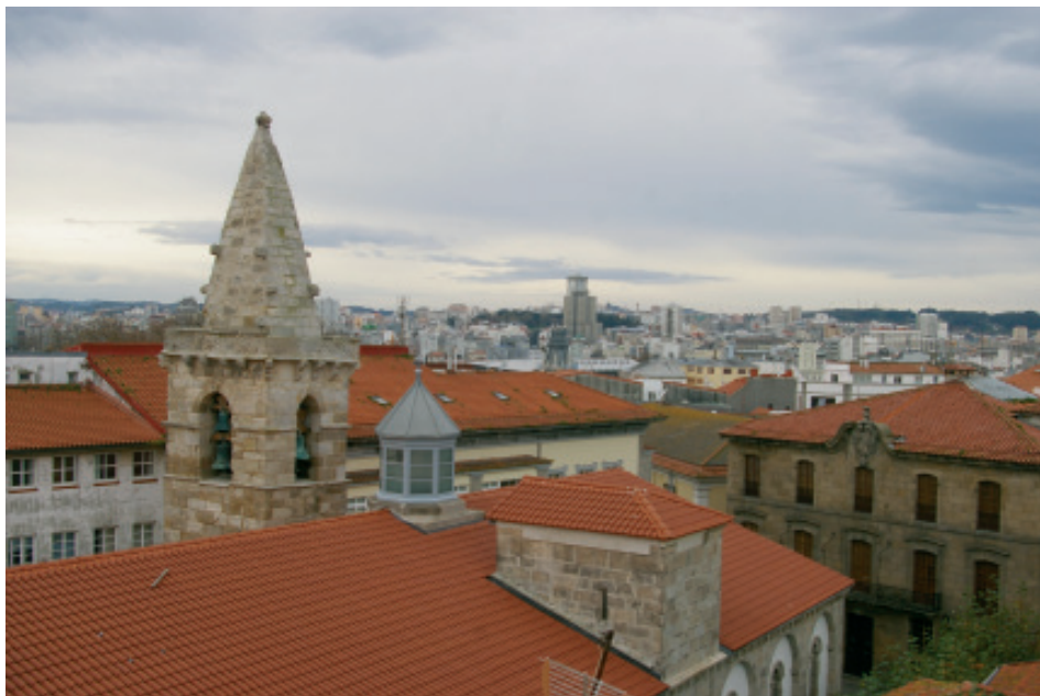
Fig 18.- Vista das torres da Colexiata de Santa María do Campo da Coruña.

seu arranque, de sillares con tracería tallada, apoiado a súa vez en ménsulas e algunha gárgola. Nas súas aristas ou esquinas ten por fóra algunhas ménsulas, escalonadas, tamén molduradas, e rematadas cun florón no cume, que serve de remate á torre e que debeu servir de peaña á cruz que hoxe non ten. Todo parece indicar que foi a derradeira en construírse e non antes da segunda metade do século XV. 10 Coa nova obra de prolongación da igrexa, a fachada correu dez metros ao occidente e as súas torres non variaron de sitio, non aparecendo agora nos ángulos senón no medio da igrexa. 11