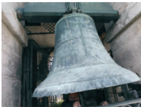
Fig 3.- Campá grande situada no oco dereito da torre-campanario da parroquia de Santiago da Coruña, feita por Antonio Blanco Palacio.