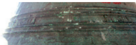
Fig 9.- O sinete (marca de fábrica) co nome de Palacio e Liste na campá do oco traseiro da torre.

grande e mediana de Xende (A Lama – Pontevedra) de 1863.