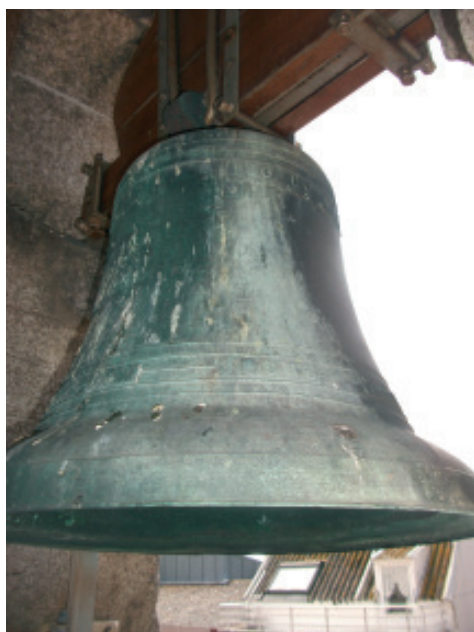
Fig 17.- Campá pequena situada no oco sur da torre dereita elaborada por José Cabrillo.

No «Medio Pé» (MP), ten 2 cordóns continuando coa inscrición: «SE FUNDIO SIENDO PARROCO EL DOCTOR DON JESUS M a VIDAL VECINO». Remata a decoración con outros 2 cordóns.