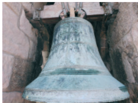
Fig 20.- Campá situada no oco norte da torre da Colexiata de Santa María do Campo.

A campá do arco Norte, á dereita conta cunhas medidas de 80cm de diámetro, 67cm de alto e cun peso de 296 Kg.