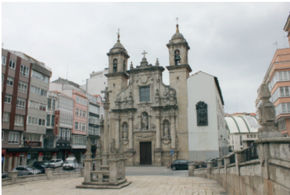
Fig 10.- Fachada da igrexa de san Xurxo da Coruña.

un edículo con aletóns. Destaca a decoración a base de placas, ás veces recortadas e pequenas; outras alongadas e rematadas en disco e outras colgantes. As torres laterais teñen tres corpos e quedan lixeiramente retrasadas. A torre norte non se rematou ata o ano 1760, e a torre sur rematouse en 1906 grazas a A. Reboredo Blanco.