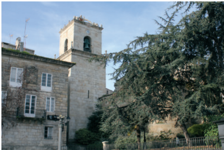
Fig 8.- Torre-campanario da parroquia de Santiago da Coruña.