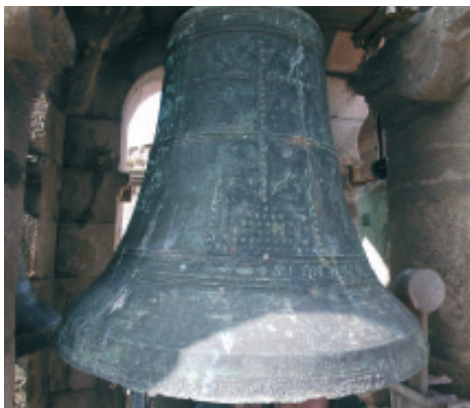
Fig 13.- Campá pequena situada no oco norte da torre esquerda da igrexa de san Xurxo elaborada por Zedrun.

No «Medio» (M), presenta unha cruz cos brazos con remates trebolados e a figura dun cristo crucificado. No lado oposto está a marca do fundidor coa seguinte lenda: «GRAN FUNDICION DE / CAMPANAS / JOSE CABRILLO MAYOR / SALAMANCA».