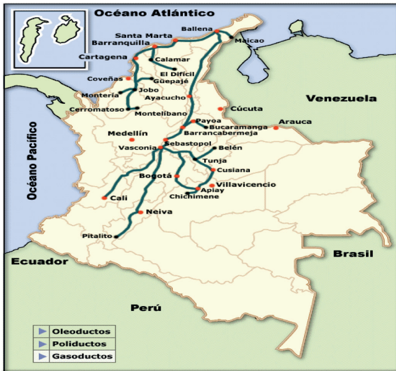
Gráfica No. 4 Red de Gasoductos Colombianos

Sumado a lo anterior es interesante considerar como en el año 2010 el número de poblaciones aumentó a 565 en 24 departamentos; el número de kilómetros de gasoductos es de 7474 km y la Región Andina concentra el mayor número de usuarios (62%) seguida de la Región Caribe (22%).