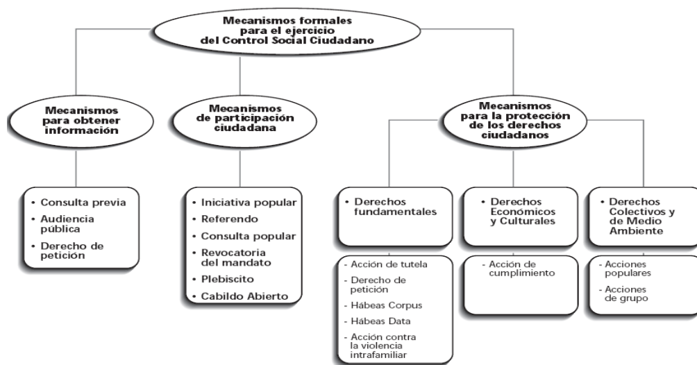
Figura 1. Mecanismos de Control Ciudadano

De esta forma, “el nuevo Estado demanda un nuevo ciudadano y una nueva comunidad donde hayan espacios de concertación y debate colectivo y público que propendan por una adecuada y transparente gestión pública. Labor donde el funcionario público se entiende como un servicio al ciudadano y a la comunidad” (Procuraduría General de la Nación, 2010). De hecho, el programa presidencial Colombia Joven (2005), ha hecho una propuesta metodológica para trabajar los mecanismos de participación y control social y ciudadano (figura 1).