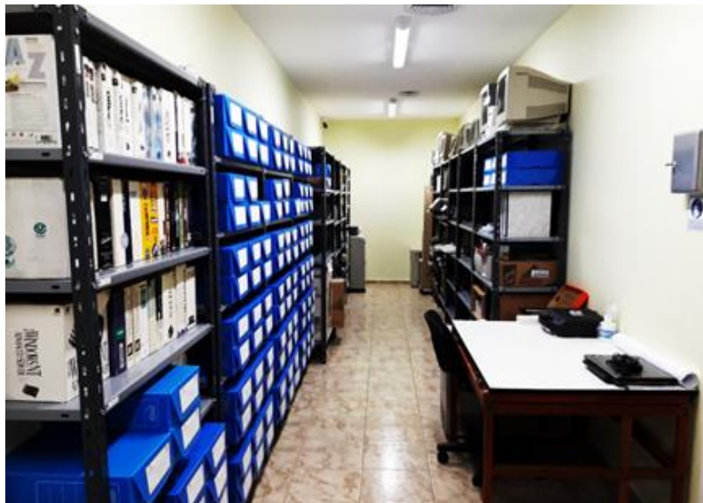
Imagen 1. Reservorio Museo de Informática. Sofía, O. Septiembre 2017

contradecir los demás. Por varios días se analizaron las posibles disposiciones de los objetos, hasta que se llegó a un consenso y se reorganizaron en base a ello. Finalmente, con las estanterías reorganizadas, se procedió a trasladar los objetos a cada una de ellas” (p.6).