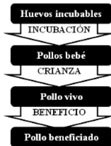
Gráfica 1. Alcance de la huella hídrica del pollo de engorde

En segundo lugar, se identificaron los procesos y actividades desarrolladas en las unidades productivas de pollos de engorde de nuestra zona de estudio según el alcance de determinado. Estas unidades fueron una planta de incubación ubicada en el distrito de Huaral, una granja de pollos de engorde ubicada en el distrito de Sayán y una planta de beneficio ubicada en el distrito de Huaral.