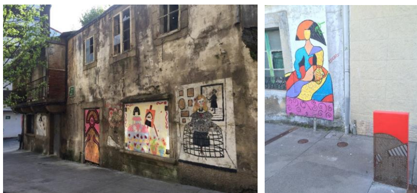
Figs. 4-5. Murales y mobiliario urbano inspirados en “Las Meninas”

Hasta la fecha se han llevado a cabo un total de siete ediciones, ya que en los años 2011 y 2012 no se pudieron celebrar por diferentes motivos. Cada año el número de pintores/as y artistas que acuden a la cita va en aumento, así como los/as vecinos/as que ceden sus fachadas para la elaboración de nuevos murales. Cabe destacar que “Las Meninas” no se limitan únicamente a la pintura, sino que engloban otras actividades artísticas. Por ejemplo, durante los días en que se celebran se realizan actividades de todo tipo: talleres para la infancia y para adultos, conciertos, representaciones teatrales, proyecciones audiovisuales, etc.