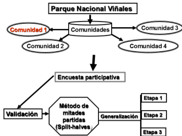
Fig. 1. Formato para comprobar la confiabilidad de la encuesta en las comunidades amazónicas.

La etapa de generalización consiste en aplicar toda la encuesta en dos momentos (Véase anexo), además de una entrevista estructurada (fase III), que propone la técnica Interlocutor-Medio-Interlocutor y considera la construcción de mensajes e información a través del diálogo que permite consultar al interlocutor especializado los contenidos de carácter científico y con el interlocutor destinatario los códigos y formas verbales, así como los contenidos, el orden y el nivel, además del momento más oportuno para compartir el mensaje. Se podrán realizar entre 13 a 15 visitas al área por un período de cinco días semanales. Durante las visitas a las comunidades se obtendrá información teniendo en cuenta: experiencia, cultura relativa al objeto de estudio y prácticas tradicionales, por lo que debe ser masiva