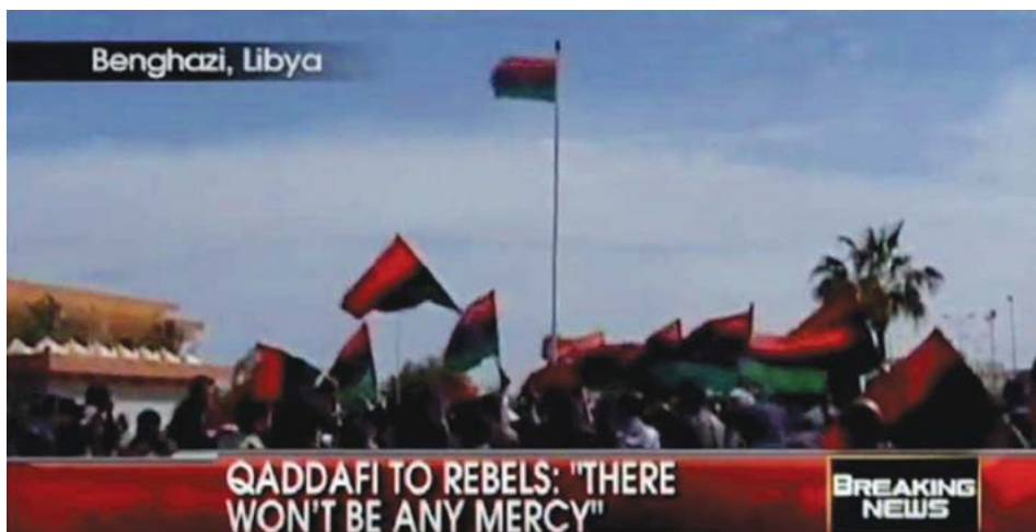
Imagen 1. Transmisión de FOX News sobre las marchas en Bengasi-Libia 2 .

En síntesis, la emisión resalta la manifestación como una acción histórica para incluir la premisa ideológica de la necesidad de incorporar la “democracia”; de esta manera, la noticia induce a justificar la necesidad que tiene la población libia de una ayuda y una intervención exterior para conseguir la anhelada “libertad democrática”, creando una especie de consenso e indignación entre los televidentes.