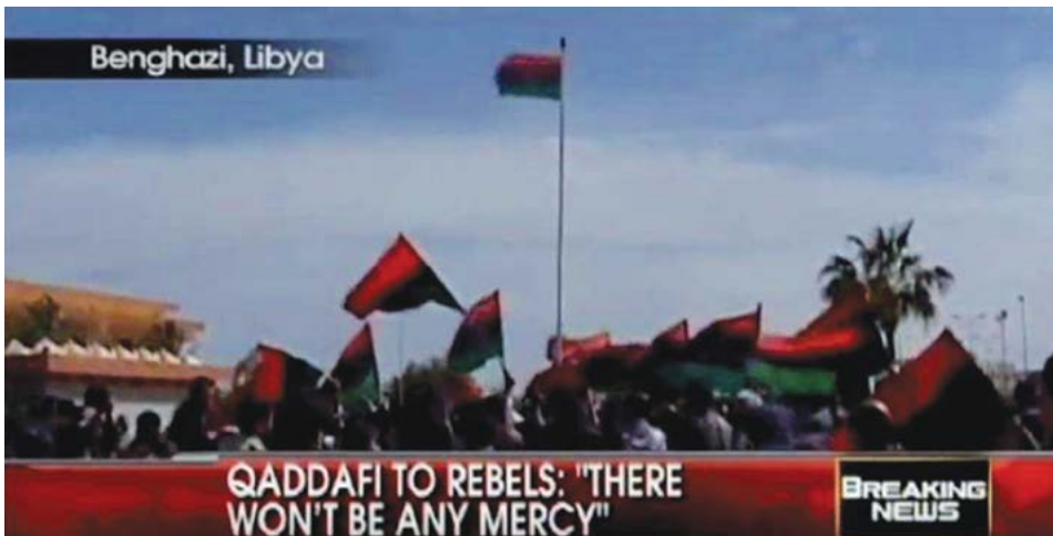
Image 1. FOX News broadcast over the protests in Benghazi-Libya 2 .

In short, the newscast highlights the protest as a historic action to include the ideological premise of the need to restore "democracy." In this way, the news primes the justification of a need to aid Libyans and an external intervention to achieve the desired "democratic freedom" by creating a kind of consensus and outrage among viewers.