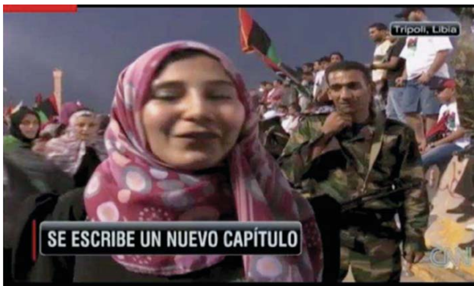
. Imagen 4. CNN transmite testimonio acerca de la alegría de algunos libios por la muerte de Gadafi 4

La escena política a través de la televisión debe provocar todo tipo de emociones, como el miedo y la esperanza, de modo que la construcción espectacular del acontecimiento sea envolvente para el televidente, de lo contrario, se tornaría en una narración aburrida sin interés emotivo para el espectador. Se busca la construcción de un show que haga una correlación de emociones de enemigos imaginarios a cientos de kilómetros que puedan destruir mientras se ve la televisión (Dayan y Katz, 1992).