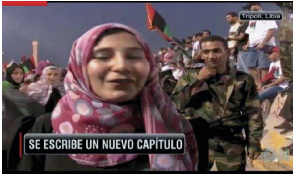
Picture 3. Picture 4. CNN shows testimonies about the joy some Libyans have regarding Qaddafi's death 4

emotions of imaginary enemies hundreds of miles that can cause destruction while one watches television (Dayan and Katz, 1992).