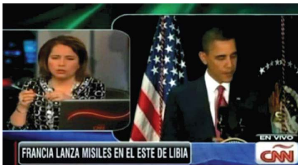
Imagen 2. Transmisión de la CNN en español acerca de los bombardeos a Libia 3 .

La presentadora anuncia que, “siguiendo la resolución del Consejo de Seguridad, la OTAN decide atacar”, con lo cual el medio de comunicación quiere justificar la legalidad de la violencia que se ejerció sobre el territorio libio. Así, cuando encuadra el anuncio de la invasión sobre los márgenes de la legalidad, se hace más justificable la acción, que se apoya en la creencia de que en los márgenes de la legalidad jurídica se encuentra la “verdad de la justicia”; de esa manera, la noticia concede racionalidad a las acciones militares y es con este fin que los medios masivos no construyen antecedentes de análisis históricos ni sociales (Bourdieu, 1997), con lo que pondría en evidencia la relatividad jurídica del orden político que ejerce la violencia justificada.