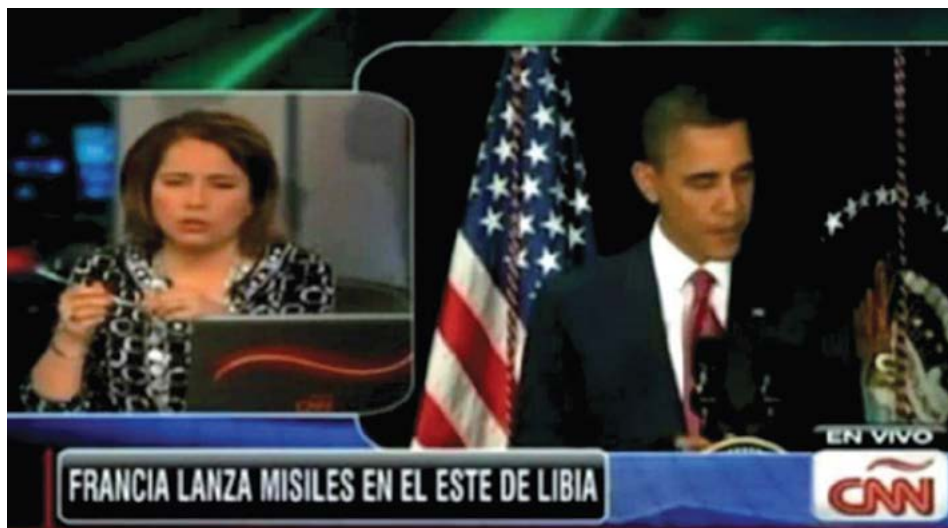
Image 2. CNN newscast in Spanish about the bombing to Libya 3 .

The TV presenter announces that, "According to the resolution of the Security Council, NATO decides to attack", whereupon the media intends to justify the legality of violence on Libyan territory. Thus, when the announcement is framed within legality, the action is justified. It is based on the belief that "truth of Justice" is on the frame of legal legality. In that way, News provides rationality to military actions, and this is why mass media do not build social or historical analysis (Bourdieu, 1997). It would put in evidence the legal relativity of the political order that exercises justified violence.