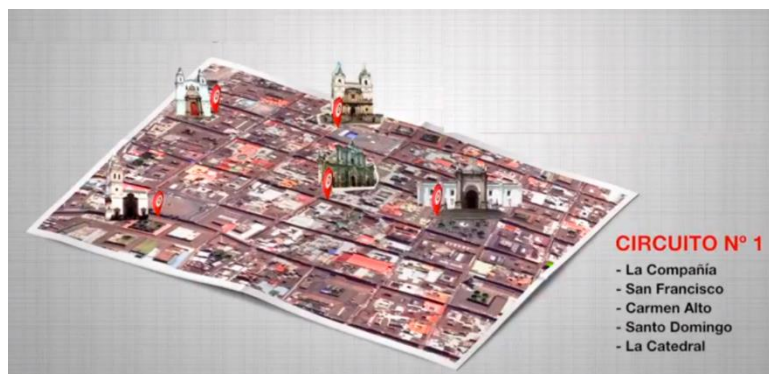
Figura 1 - Puntos de visita – Circuito 1

establecidos, en él se visitan las iglesias de La Compañía, San Francisco, Carmen Alto, Santo Domingo y La Catedral (Figura 1).