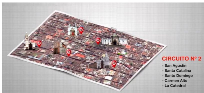
Figura 2 - Puntos de visita – Circuito 2 Fuente - (Ministerio de Turismo del Ecuador, 2015).

Agustín, Santa Catalina, Santo Domingo, Carmen Alto y La Catedral (Figura 2).