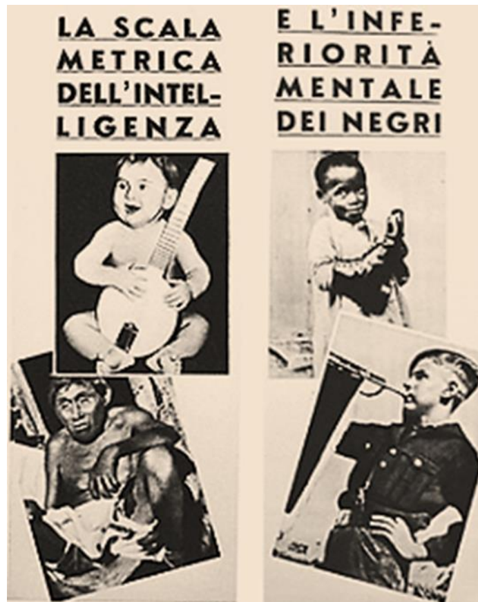
Cartaz de Propaganda Fascista/ A revista italiana fascista coloca lado a lado crianças italianas, de “raça superior”, e negros das colônias, mostrando a pretensa superioridade da raça do império. In: http://anpi.it/media/uploads/files/2017/12/difesa_della_razza_a1_n1.pdf .