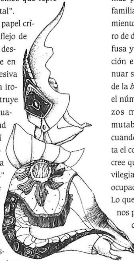
Restituidos al reino (detalle), 1974

Y esto no debe entenderse como el producto de un individualismo en crecimiento, un individualismo definido como crisis de las solidaridades colectivistas y las relaciones sociales igualitarias. Veamos, tan sólo, en el inmenso desinterés que han caído, en los últimos tiempos, todas las instituciones, normas y finalidades que organizaban el imaginario moderno. El conocimiento, el poder, el trabajo, la familia, el partido político, los sin-