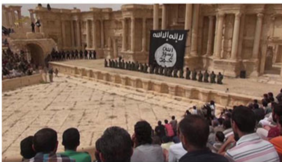
Imagen del vídeo difundido por el Estado Islámico (2015). Palmira

del asesinato. Un recorrido desde sus celdas hasta el teatro romano; todo ello acompañado con sonido. Esto, por supuesto, requiere una planificación, tanto de pre como de post producción. Todo el ambiente del vídeo está pensado y planificado como un espectáculo: el escenario del teatro, los niños con su disfraz de uniforme militar, manifestando una férrea disciplina en su disposición en línea recta. Delante de ellos, los soldados condenados, de rodillas, esperando la orden del disparo. Cuando la reciben los niños la cumplen todos a la vez, sin dudarlos. Como si lo hubieran practicado muchas veces antes de subir al escenario y enfrentarse al público que acudía al anfiteatro romano aquel día. Una ceremonia de ficción que se ha convertido en realidad, una “producción enloquecida de lo real y lo referencial, paralela y superior al enloquecimiento de la producción material”, como intuyó hace tiempo Jean Baudrillard (1977, Pág.19)