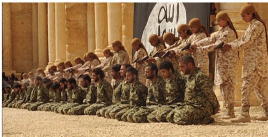
Imagen del vídeo difundido por el Estado Islámico (2015). Palmira

La escena final de la película muestra a los niños yemeníes disparando a los soldados estadounidenses.