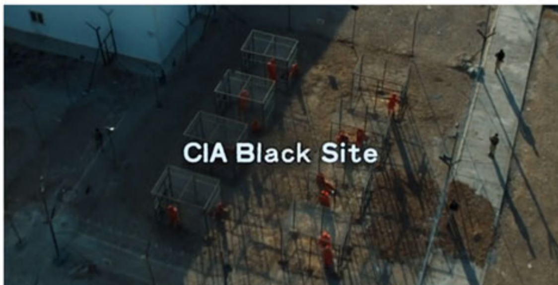
Imagen de la película Zero Dark Thirty

En la mayoría de los vídeos que ha generado ISIS, las víctimas (que serán sus condenados) llevan el mismo uniforme naranja que portaron los condenados en Abu Ghraib y en los Black Sites de la CIA. Y están encarcelados en las mismas jaulas que hemos visto en la película de Bigelow (jaulas más propias de animales).