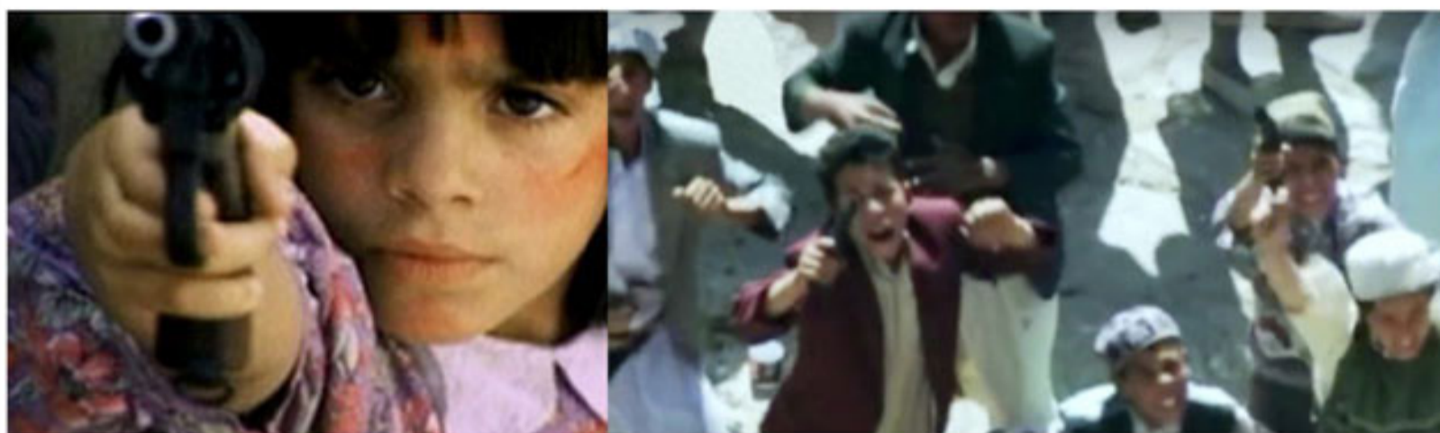
Rules of Engagement (2000), Película

a Yemen y aborda la cuestión del juicio del coronel estadounidense (Terry Childers) después de dar la orden de disparar y matar a un gran número de civiles fuera de la embajada de Estados Unidos, incluyendo niños y mujeres. La película termina con Childers declarado culpable por un cargo menor, alteración del orden público, dado que algunos miembros de la multitud estaban realmente armados y disparando contra los infantes de marina. Los niños que aparecieron como víctimas al principio acabaron siendo enemigos que recibieron ordenes de un terrorista islamista para matar a los soldados americanos .