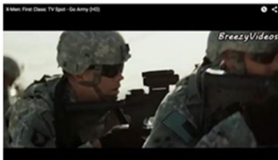
X-Men: First Class: TV Spot - Go Army

Hay un anuncio/propaganda en el que se desplazan los X-Men , con imágenes de soldados en uniforme militar que realizó el Ejército Fuerte como campaña de marketing del año. En un flash, la imagen del soldado se convierte en la imagen del súper héroe virtual. El anuncio cierra con la frase “ There is Strong and then there is Army Strong ”. Una invitación a los jóvenes para formar parte del ejército, pues de ese modo pueden pasar de ser simple “gente normal” a ser “superhéroes” con poderes extraordinarios: “...una fantasía ideológica, (...) un intento de alcanzar metas imposibles” (Gray, 2014b)