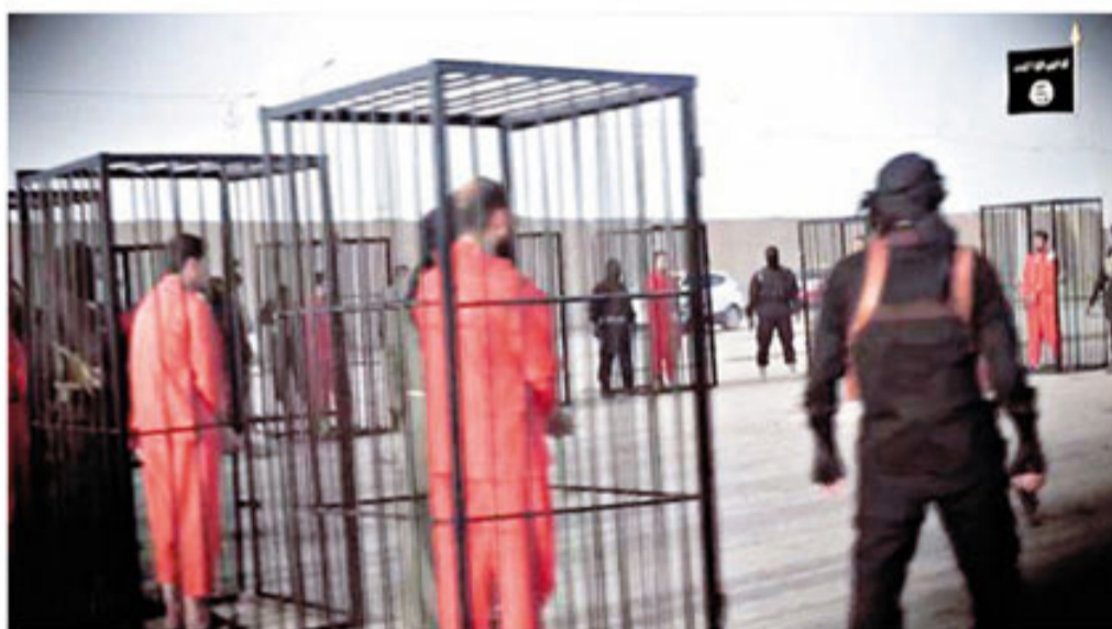
Imagen del vídeo difundido por Isis

El cambio que hemos presenciado en la imagen representativa del Medio Oriente durante décadas, a través de la pantalla de Hollywood, es un paralelismo con los cambios en las tendencias políticas estadounidenses (tanto de la Casa Blanca como del Pentágono). Todos los enemigos políticos de los EE.UU eran los enemigos de los héroes americanos en las pantallas de Hollywood. Y la colaboración entre los dos tuvo un enorme efecto en los cambios de la opinión pública.