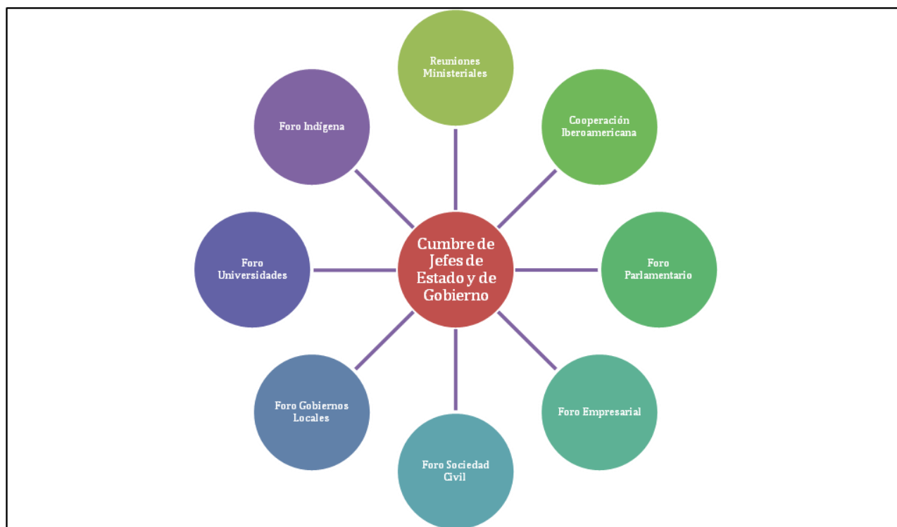
Figura 3: Relación de actores de la Conferencia Iberoamericana

Además de las relaciones que estrictamente se vinculan a la Cooperación Iberoamericana, en el ámbito de la Conferencia Iberoamericana se han ido realizando distintas reuniones ministeriales y sectoriales que componen un sistema de interacción articulado de los Jefes de Estado y de Gobierno con distintos actores estratégicos que conforman un estudio de caso inigualable sobre la relación de diferentes actores para el desarrollo sostenible. Coincide que la relación tradicional entre actores de la Conferencia Iberoamericana lo es con los mismos actores que la Agenda 2030 identifica como más estratégicos y necesarios: el parlamento, el sector privado, los gobiernos locales, la sociedad civil y las universidades.