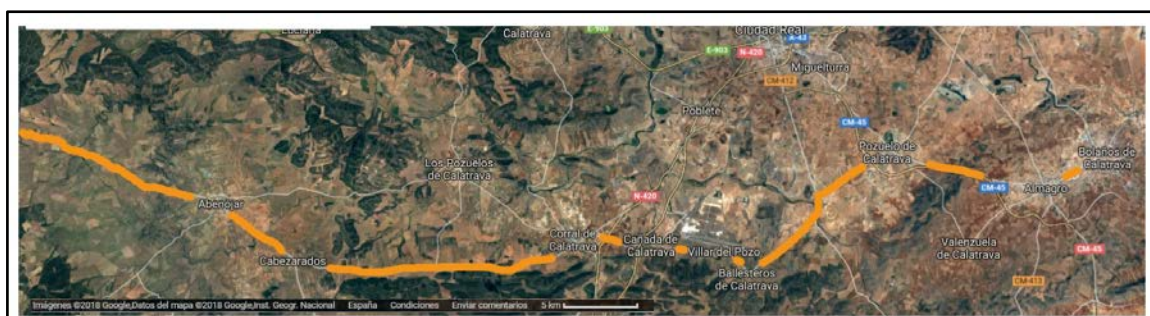
Figura 6: Detalle de una de las variantes del Camino de Guadalupe (Camino de Levante) a su paso por la provincia de Ciudad Real.

El trazado histórico correspondiente al último tramo del camino, a veces denominado Camino del Sácer, comienza en Saceruela (Ciudad Real) y tiene una longitud de 114 km. La Orden del Sácer, fundada en 1570, fue una de las primeras instituciones romeras establecidas fuera del dominio jerónimo en Guadalupe; y principal impulsora en el mantenimiento de hospitales e infraestructuras creadas en beneficio de los peregrinos con el objetivo de mantener los hospitales del camino a Guadalupe y asistir a peregrinos y necesitados que frecuentaban esta ruta. La última localidad en la provincia de Ciudad Real es Agudo.