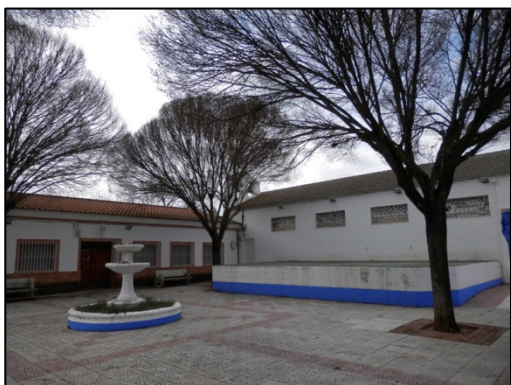
Figura 4: Plaza de Don Martín Elizondo Recalde, anexa a la iglesia.

un anteproyecto de Luis Cubillos de Arteaga 49 . La iglesia actual es un edificio nuevo construido en 1969 50 .