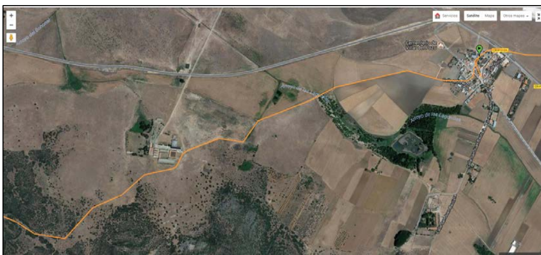
Figura 8: Ruta cicloturista: finca de La Higuera atravesada por el Camino de Guadalupe (detalle).