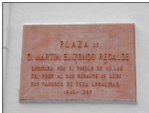
Figura 5: Placa con el nombre de la plaza.

La entidad poblacional de Ballesteros y de La Higuera resultaría ser muy escasa, pues ninguna de las dos había logrado hasta ese año levantar un edificio y haberse constituido a su vez en parroquias. Los esfuerzos realizados por los propietarios nobles de estas dos entidades por ser repobladas habían sido escasos, pues no prosperaron como en Villar del Pozo.