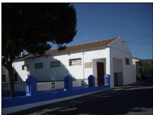
Figura 3: Iglesia parroquial de Villar del Pozo 48 .

En las partidas parroquiales de dicha localidad la iglesia aparece, como su vecina de Ballesteros de Calatrava, bajo la advocación de Nuestra Señora de la Consolación.