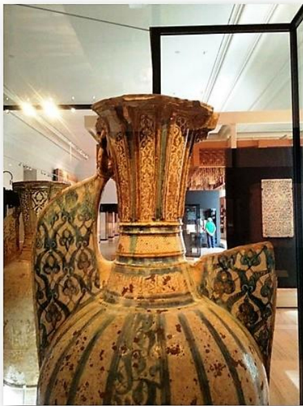
VISTA GENERAL DE LA ZONA DEL CUELLO DEL JARRÓN NAZARÍ.