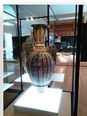
VISTA GENERAL DEL JARRÓN NAZARÍ, EN LA SALA Nº 23 DEL M.A.N.