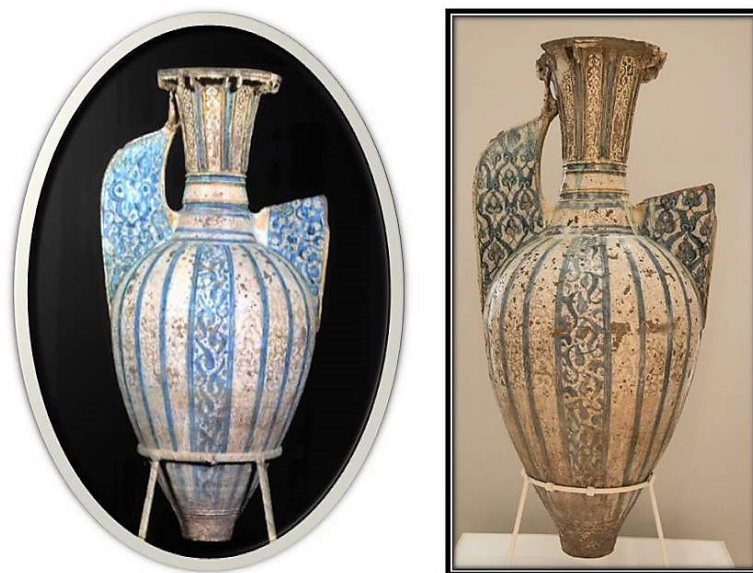
Vista anterior y posterior del jarrón nazari de Homos.