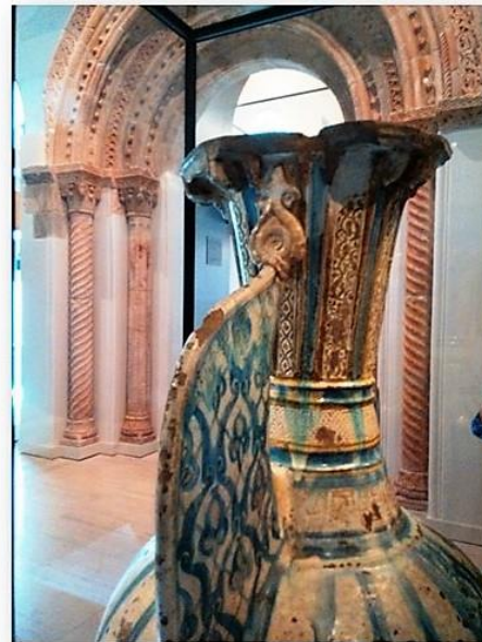
F05) VISTA GENERAL DE LA ZONA DEL CUELLO DEL JARRÓN NAZARÍ