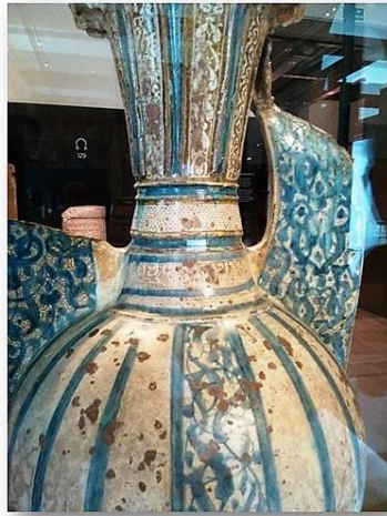
VISTA GENERAL DE LA ZONA CENTRAL DEL JARRÓN NAZARÍ.