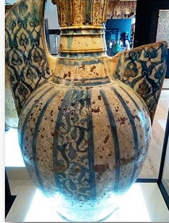
F04) VISTA GENERAL DE LA ZONA CENTRAL DEL JARRÓN NAZARÍ