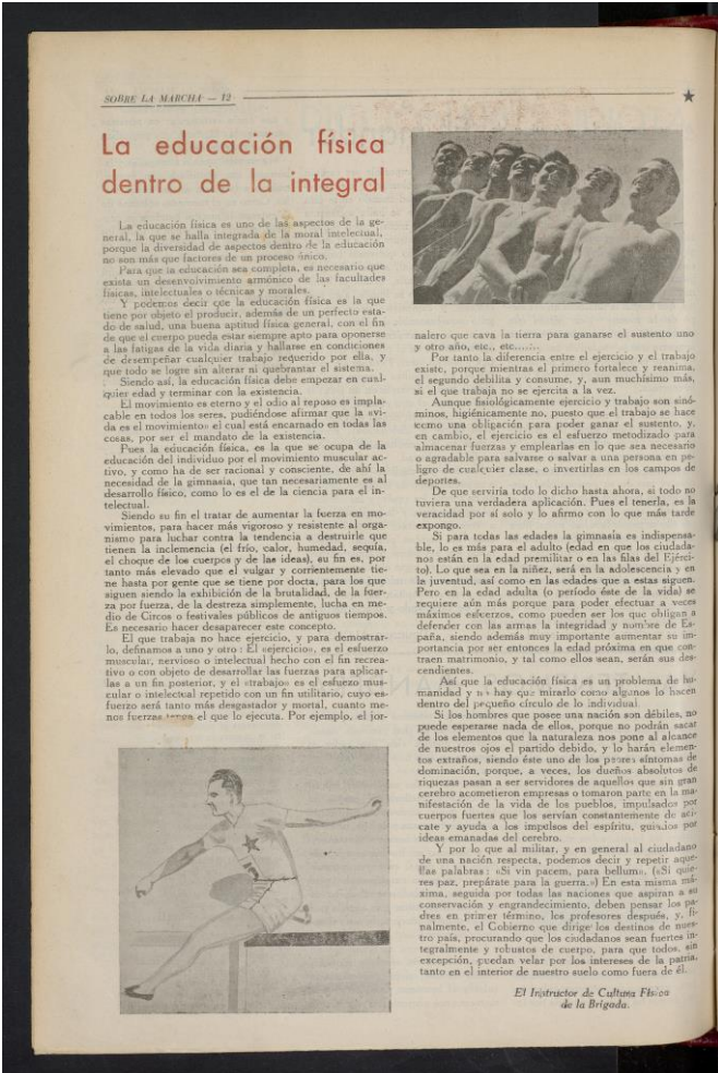
Imagen 3: Sobre la marcha nº 48, (18/2/1938). HMM.