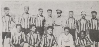
EL EQUIPO DE FUTBOL DEL SEGUNDO BATALLON

El ideal de sociedad por el que se estaba luchando y al que se llegaría tras la victoria se representó mediante la inclusión de fotografías de eventos deportivos y deportistas rusos. Se describía como una sociedad donde los