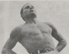
De aquella consigna gloriosa: "Físicamente, sanos; políticamente, seguros". Estará formado nuestro Ejército popular.