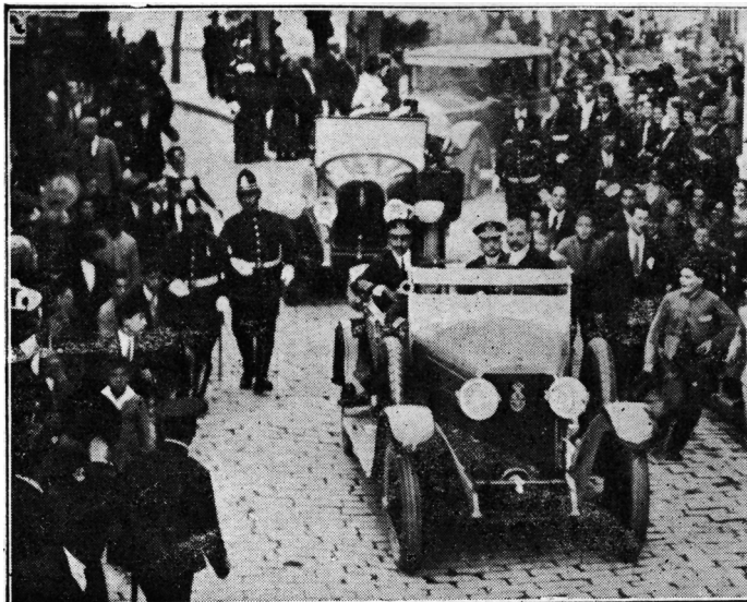
Imagen 1. Alfonso XIII en coche acompañado del ministro de Marina y del alcalde de Huelva durante su visita a la ciudad con motivo de la recepción de los aviadores del Plus Ultra (1926).

de Málaga: fábrica de azúcar La Zamarrilla, Industria Malagueña de los Larios, la destilería de los señores Jiménez y Lamothe o los altos hornos de la familia Heredia. 24