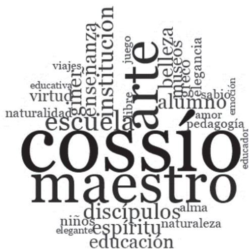
FIGURA 2. Nube con la frecuencia de palabras en artículos sobre Cossío