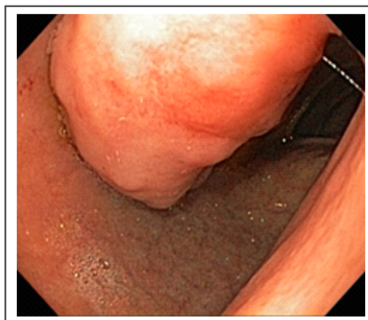
Figura 1. Cara anterior del bulbo duodenal con lesión protruyente, de pedículo grueso, lobulada, de superficie irregular y erosionada, de 3 cm de diámetro

El estudio histológico reveló una masa constituida por glándulas de Brunner separadas por tabiques de tejido fibromuscular y vasos sanguíneos (figura 3).